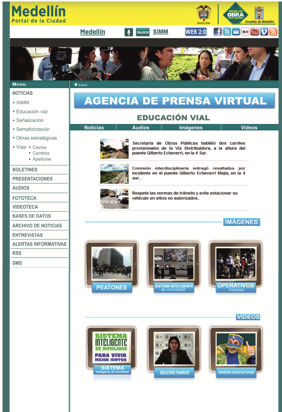
Imagen 6. Agencia de Prensa Virtual