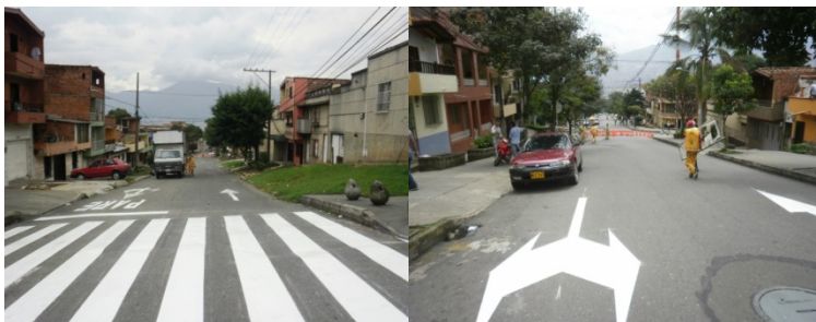
Señalización en Aranjuez (Carreras 48 y 49 entre las calles 92 y 96)

Para la señalización de este lugar, la Administración Municipal invirtió cerca de 12 millones de pesos. La señalización de algunas vías en el barrio Aranjuez ha tenido resultados satisfactorios. En este punto de la ciudad, hoy los peatones y conductores transitan bajo mejores condiciones de movilidad y seguridad vial.