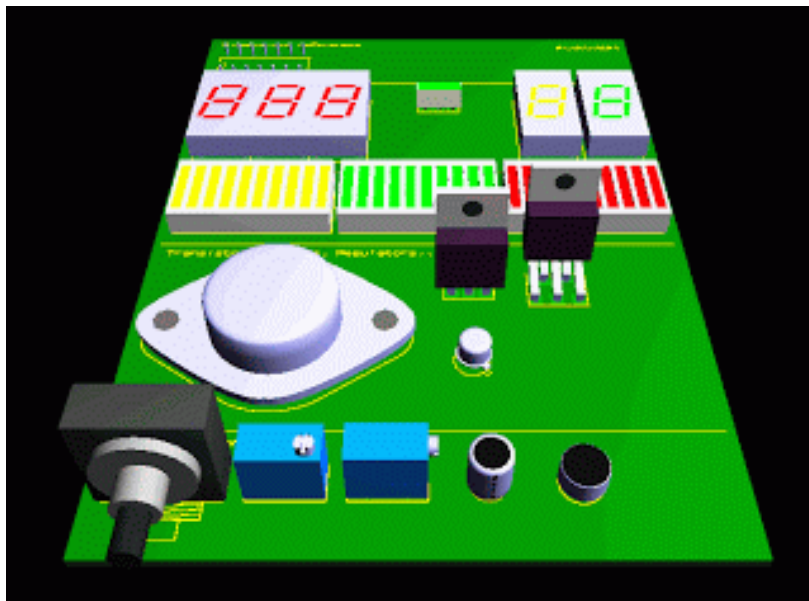
Ilustración 1 Simulación de un diseño eléctrico en 3D