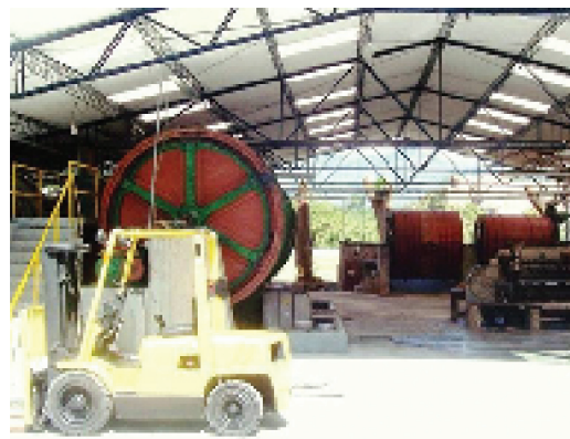
Foto 2. Planta de producción después del cambio tecnológico

2. Reducción de los consumos de insumos químicos: debido al cambio que se generó por los equipos instalados, los cuales tienen mayor acción mecánica sobre las pieles, y con la reducción del consumo de agua, fue posible optimizar las formulaciones y disminuir los consumos de insumos químicos por Kg de piel procesada. En la tabla 5 se ven los indicadores de consumos de químicos 7 .