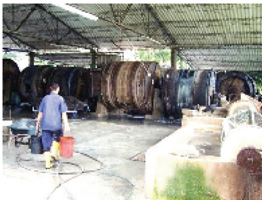
Foto 1. Planta de producción antes del cambio Tecnológico.