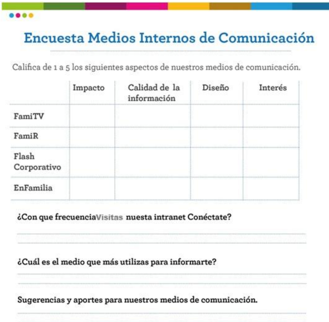
Ilustración 14 Ejemplo encuesta