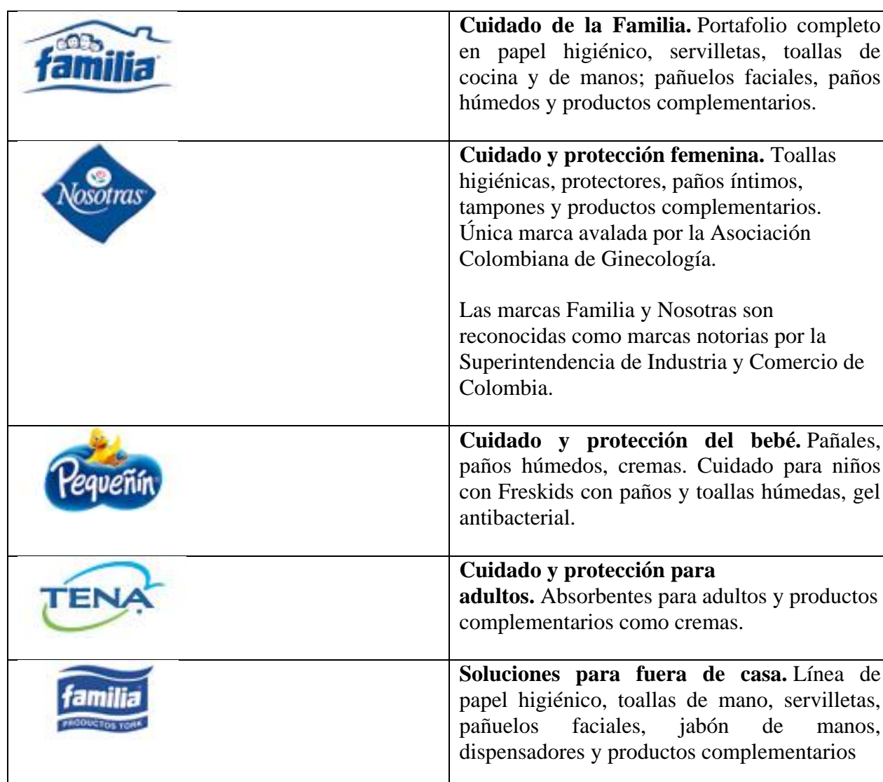
Ilustración 1 Marcas de Grupo Familia