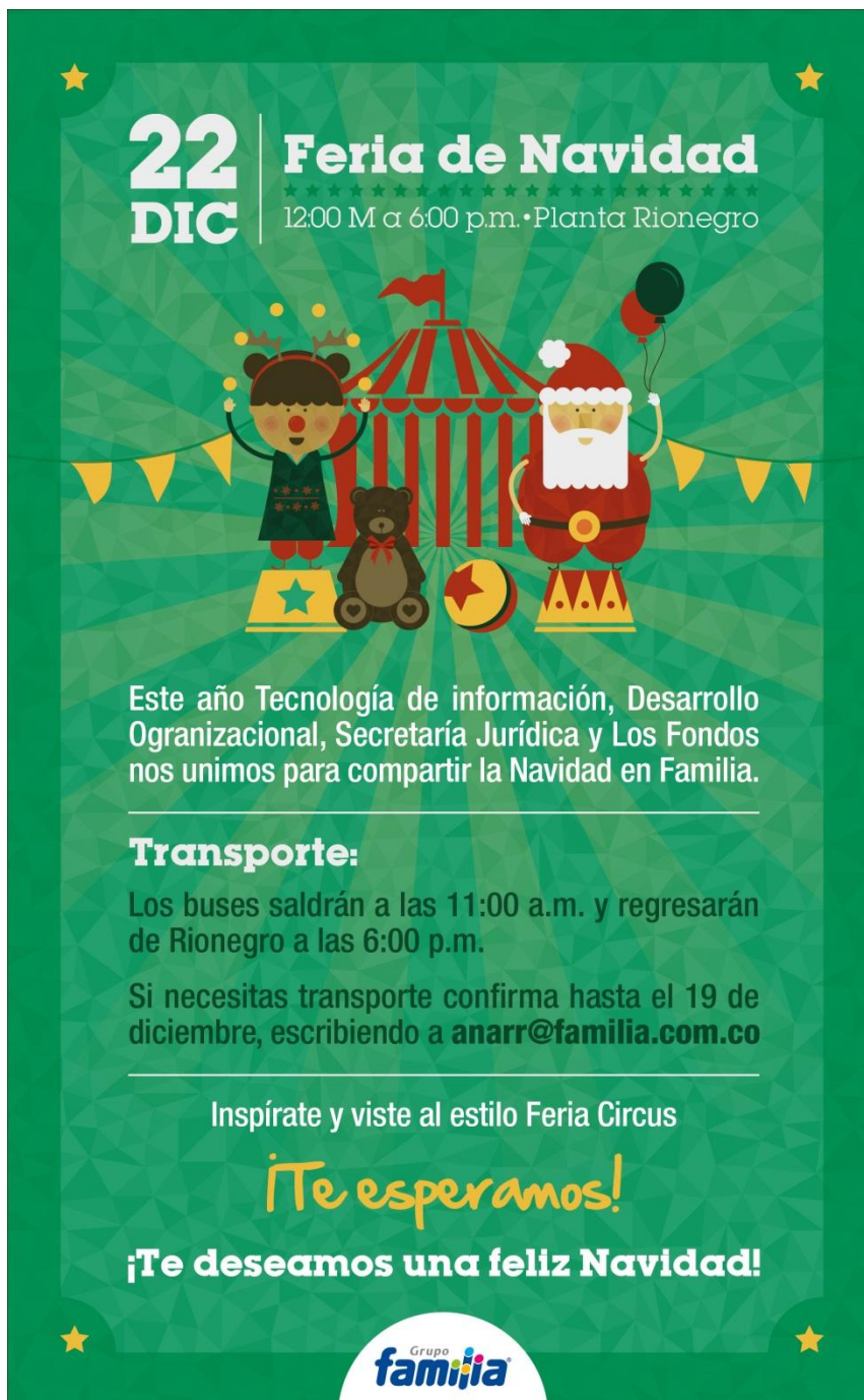
Ilustración 5 Flash Invitación fiesta de Navidad