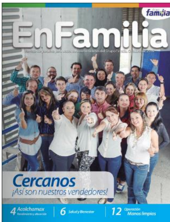
Ilustración 7 Revista EnFamilia

La revista corporativa es impresa y llega a todos los colaboradores, además se publica en versión virtual en nuestra Intranet Conéctate. Se destacan los hechos que les permiten celebrar, promover y acompañar.