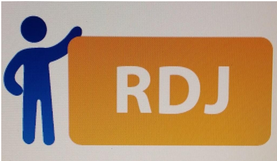
Ilustración 12 logo de RDJ

Las RDJ son (Reuniones Donde el Jefe) las cuales se realizan periódicamente que convocan y lideran los jefes de cada área para tratar temas de interés e importantes con los equipos de trabajo.