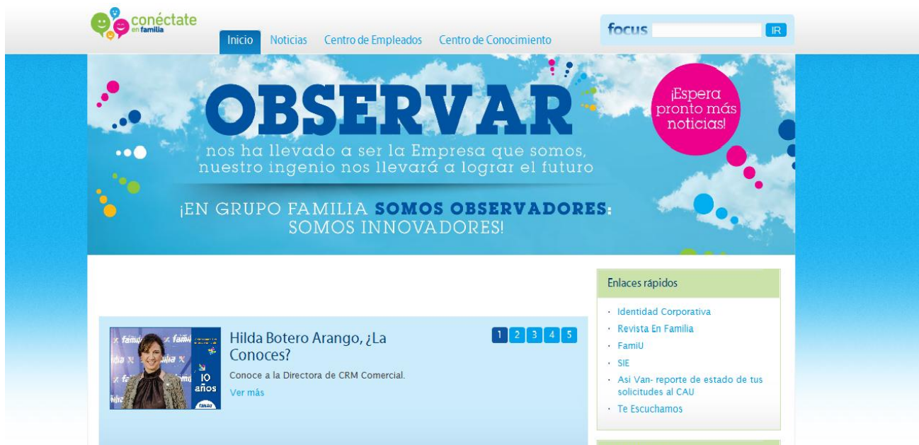
Ilustración 6 Intranet Conéctate

Funciona con la dinámica de las redes sociales, es un medio dirigido a todos los colaboradores administrativos, donde se publican noticias de importancia y relevancia a nivel corporativo.