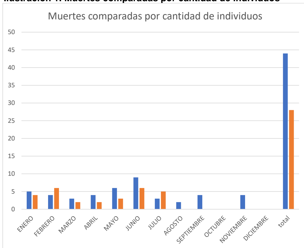
Ilustración 1. Muertes comparadas por cantidad de individuos

En la figura 1 se observa la cantidad de animales muertos en comparación de los años 2017 y 2018, donde se determina que el 2017 fue mayor en cantidad de animales muertos a excepción de los meses de febrero y julio.