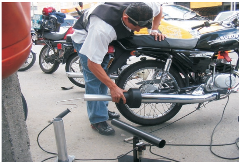
Figura 2. Banco analizador de gases Andros 4261, filtro de vapores de aceite y sondas para toma de muestras.