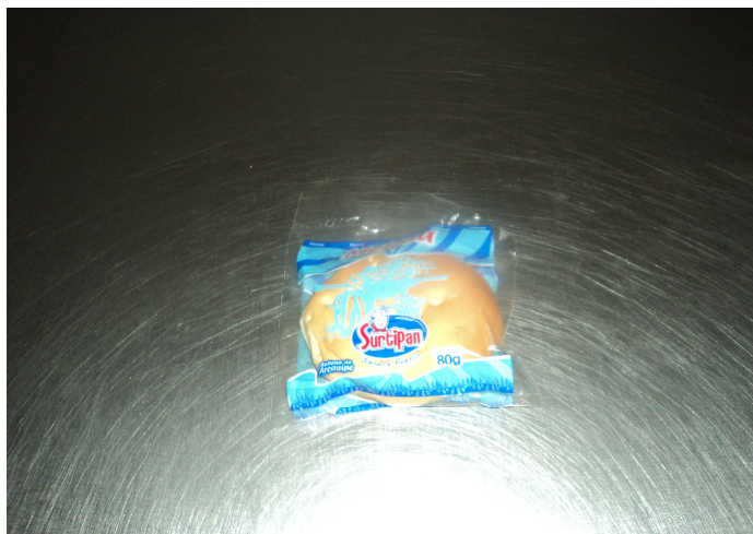
Figura 3 Melosa

4.1.3 Melosa: Masa blanda de textura suave rellena de arequipe, sabor dulce y agradable con acabado dorado resultado del horneado. Ingredientes: Harina de trigo, agua, azúcar, sal, levadura, grasa vegetal, mejorador, propionato de calcio y esencias.