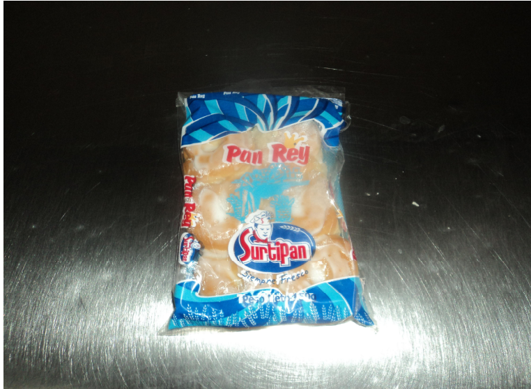
Figura 4 Pan rey

4.1.4 Pan rey: Masa blanda de textura suave, resultado del proceso controlado de panificación, sabor agradable y ligeramente fermentado, con acabado dorado resultado del proceso de cocción. Ingredientes: Harina de trigo, agua, azúcar, sal, levadura, grasa vegetal, mejorador, esencias y propionato de calcio, azúcar pulverizada.