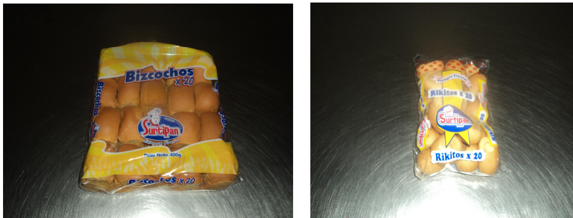
Figura 2 Bizcocho