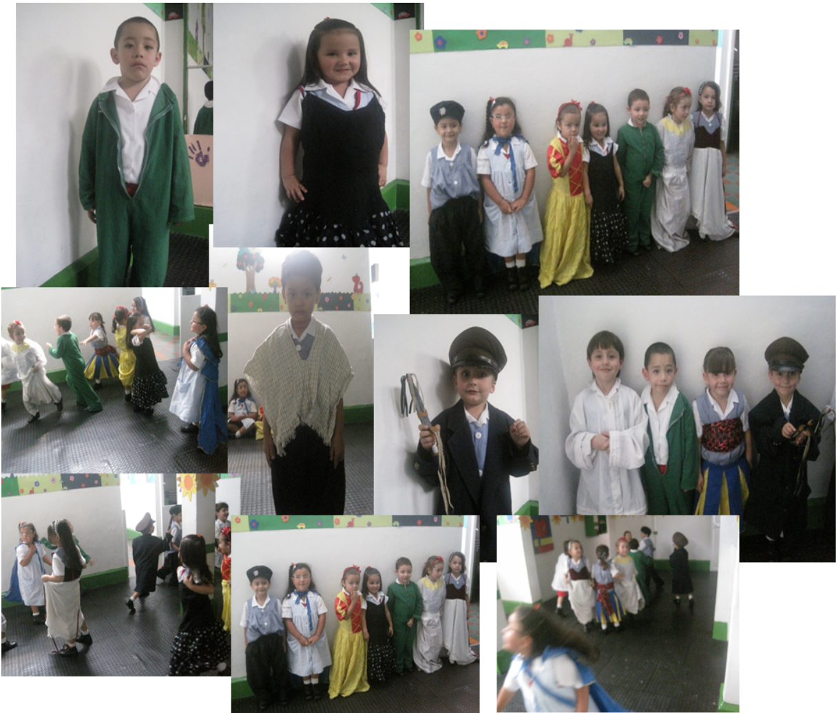
Gráfico 5 Fotos – evidencias