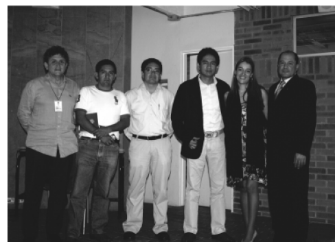
Representantes de la Universidad Nacional Toribio Rodríguez de Mendoza de Amazonas Perú acompañados por la Decana de la Facultad de Ciencias Administrativas y Agropecuarias de la Corporación

Entre ellas vale la pena destacar el desarrollo de la Jornada Académica Internacional de Sostenibilidad y Entorno Ambiental en el Sector Agropecuario y la presentación de los grupos de investigación de las facultades de Ciencias Administrativas y Agropecuarias y de Ingenierías. Asimismo, las visitas en Antioquia a la hacienda ganadera La Vitrina, la granja Santa Inés, la empresa cárnica Casana, al Centro de Investigación La Selva de la Corporación Colombiana de Investigación Agropecuaria CORPOICA, a la planta de tratamiento de aguas residuales San Fernando y a la Universidad Católica del Norte.