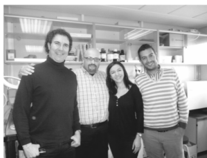
Representantes del CEBAS al lado de la Docente Coordinadora de Ingeniería de Alimentos y del docente del mismo Programa