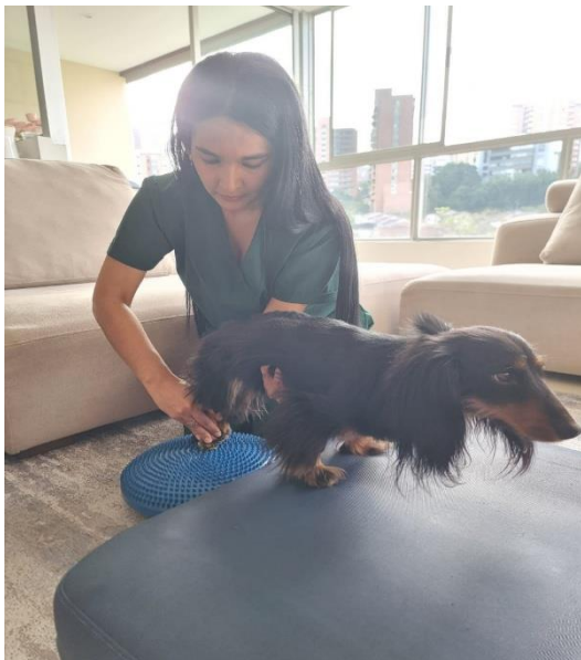
Imagen 17: Ejercicios propioceptivos