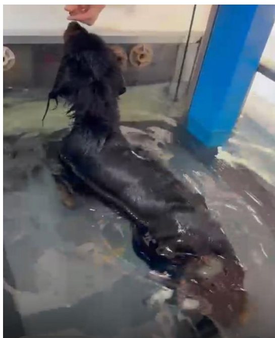
Imagen 15: Terapia en cinta acuática