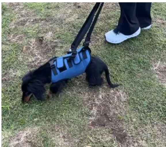
Imagen 11: Cinesiterapia activa asistida con arnés doble