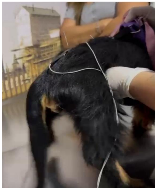
Imagen 13: Terapia electro acupuntura