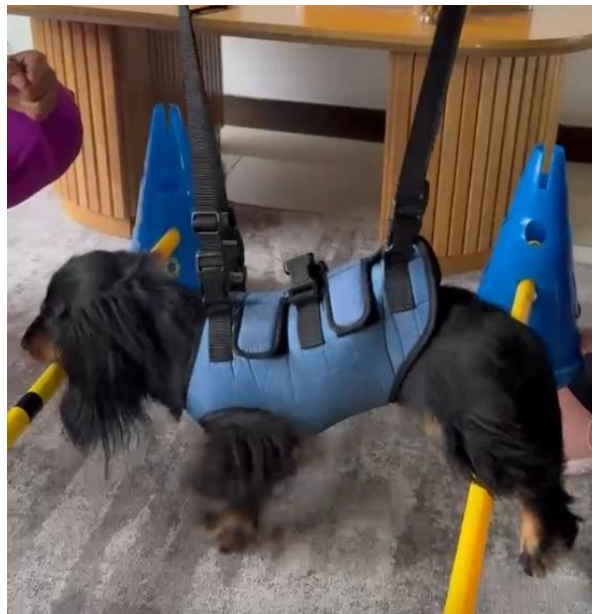
Imagen 14: Ejercicios con cavaletti