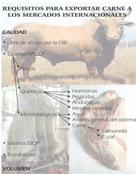
Figura 2. Requisitos para exportar carne a otros mercados

La genética, el tipo de pastos que consume el animal, los procesos y protocolos para el transporte y sacrificio, son factores determinantes en la calidad de la carne. En la actualidad se realiza una calificación por medio de estrellas (1, 2, 3, 4 y 5 estrellas) para determinar la calidad y eficiencia de las canales, esto teniendo en cuenta, como factores determinantes la ternura y la resistencia al corte que se da en Kgf (Kilogramos Fuerza). Por ejemplo, las ganaderías que producen canales 4 y 5 estrellas, son canales que presentan edades entre 2.5 a 3.5 años, de animales machos con un acabado de peso de la canal en frío mayor o igual a 230 Kg para los de 5 estrellas y mayor o igual de 210 Kg para los de 4 estrellas (Lafaurie Rivera, 2011).