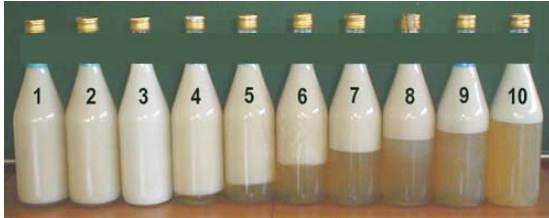
Foto 1. Escala de deterioro del producto

terioro que presentaban las muestras de acuerdo con el nivel del tanque de donde procedían y las condiciones de almacenamiento que tuvieron. Para todos los análisis de la investigación se determinó la escala de deterioro del producto en comparación con algunos productos terminados proporcionados por la empresa. (Foto 1)