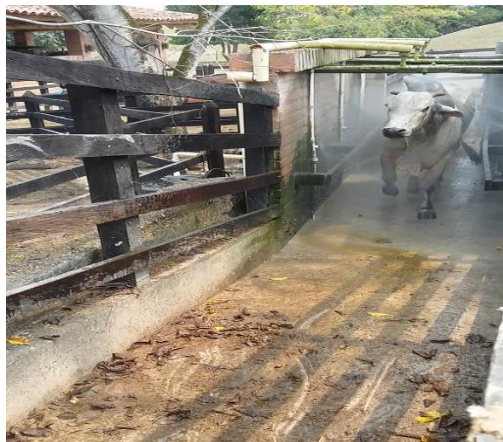
Foto 4. Baño por aspersión