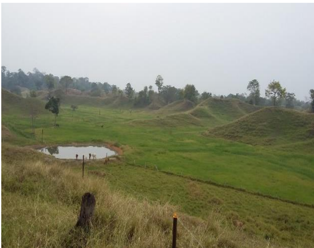
Foto 1.Hacienda la Traviata

Adicionalmente, cuenta con muy pocos puntos de sombra en los potreros, ya que se ha hecho deforestación inadecuada de maderas, no teniendo en cuenta este recurso vegetal para el confort del ganado. Solo cuenta con dos reservas de bosque; en total suman unas 50 hectáreas, que son conservadas para uso de madera en la hacienda.