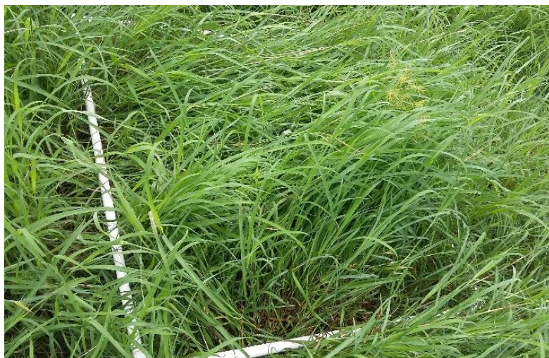
Foto 9. Aforo de forraje fresco

La evaluación de la oferta forrajera por medio de los aforos, busca determinar mediante mediciones aleatorias la oferta real de forraje que se tiene en cada potrero al ingresar el ganado, así como también, se calcula un desperdicio del pasto ya que se toman muestras al ingreso.