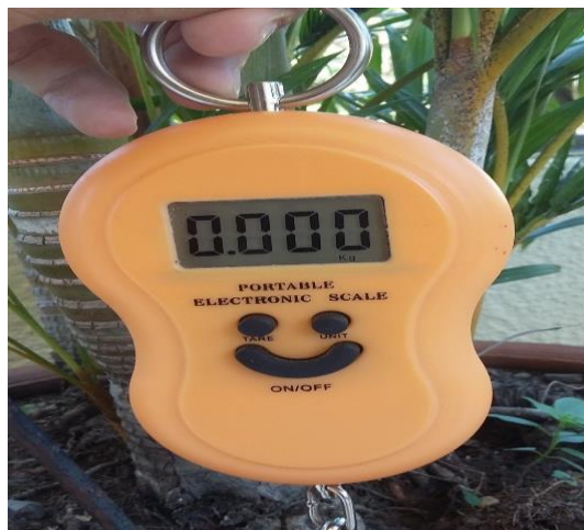
Foto 10. Báscula digital para pesar forraje

Para realizar el sistema de medición de la oferta forrajera se empleó el método: aforo ponderado; que consiste en elaborar un marco cuadrado en PVC de un \text{m}^2 . Al ingresar al potrero se toman 9 muestras, buscando siempre que estén repartidas en el área tomando en cuenta el crecimiento del pasto que puede ser alto, medio y bajo que representen las especies forrajeras encontradas en cantidad y desarrollo. Luego se procede a cortar el forraje contenido en el marco y pesarlo para determinar la masa de forraje verde por metro cuadrado. Los datos hallados se expresan en Kilogramos de forraje verde por metro cuadrado