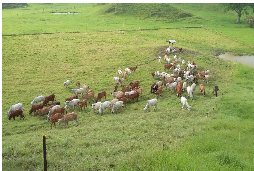
Foto 7.potrero alemán 5

Se puede decir que el sistema empleado, no hay oportunidad para que el ganado rechace algunas especies; por el contrario, se hace un gran aprovechamiento del recurso forraje y se evita al máximo el desperdicio. Sin embargo, una retención excesiva de los animales puede desencadenar en un déficit de energía y nutrientes que puede llevar a problemas productivos y reproductivos de gran magnitud. Por eso, se hace este manejo con cuidado y permanente evaluación de la condición corporal general del lote y la presión de pastoreo con la que es manejado.