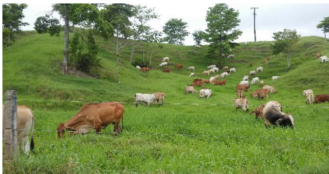
Foto 6.tipo de animales