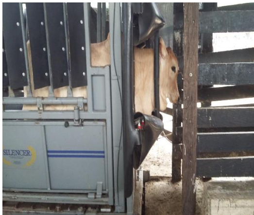
Foto 3. Brevete hidráulico