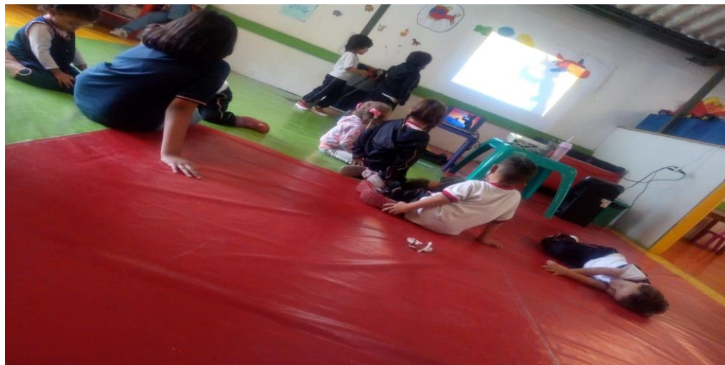
Ilustración 7. Gimnasio (2021)