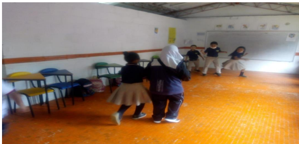
Ilustración 6. Salón (2021)