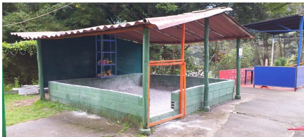
Ilustración 8. Arenera (2021)