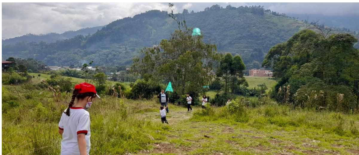
Ilustración 4. Manga Salle (2021)