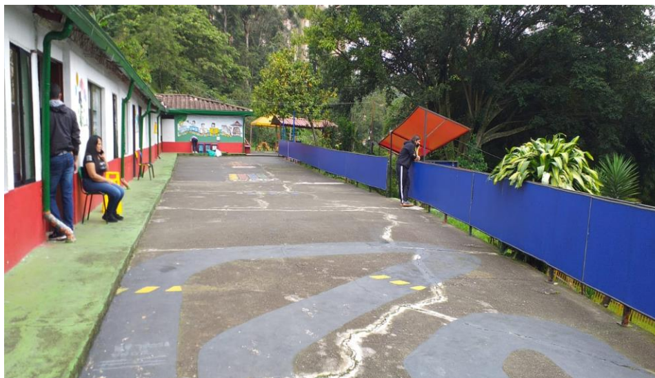
Ilustración 11. Patio (2022)