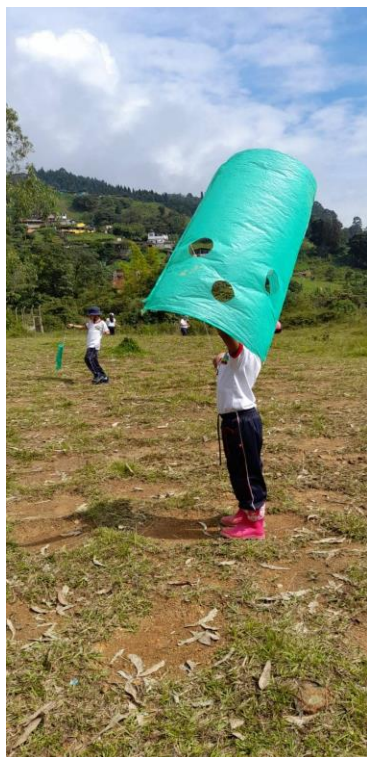
Ilustración 12. Manga Salle (2021)