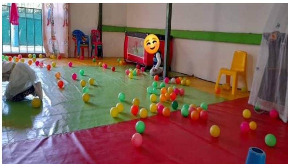
Ilustración 14. Gimnasio (2021)