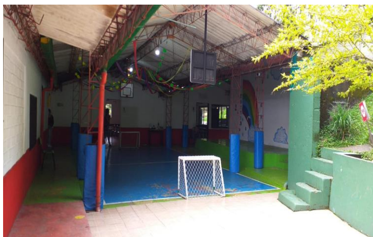
Ilustración 10. Cancha (2022)