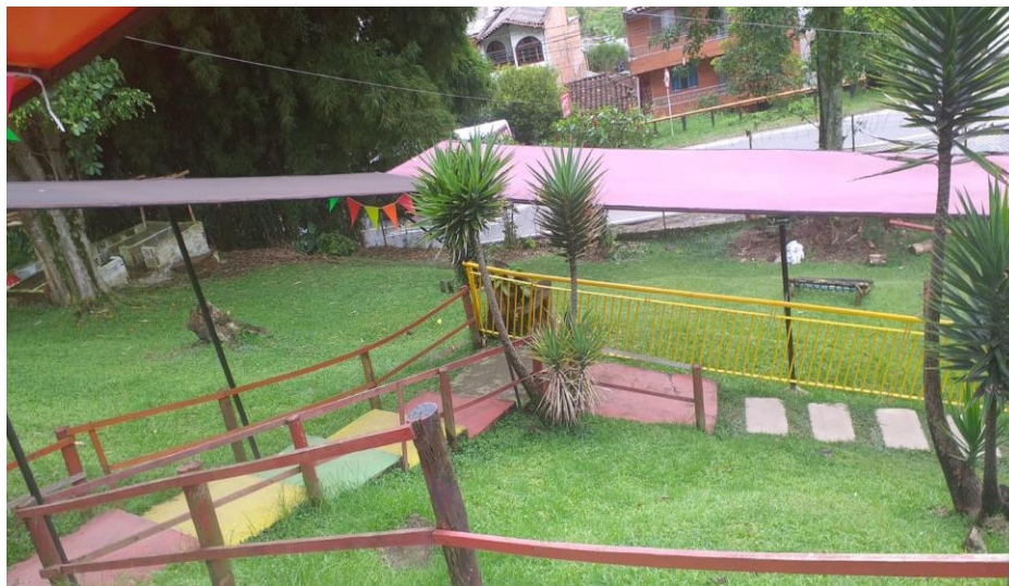
Ilustración 13. Colegio (2022)