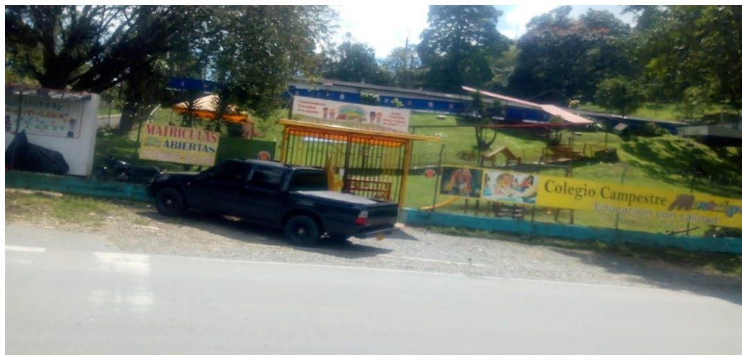
Ilustración 5. Colegio (2022)