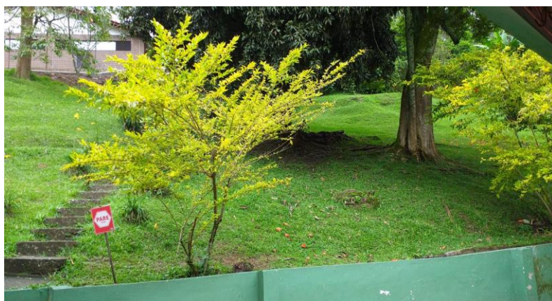
Ilustración 9. Montaña (2021)