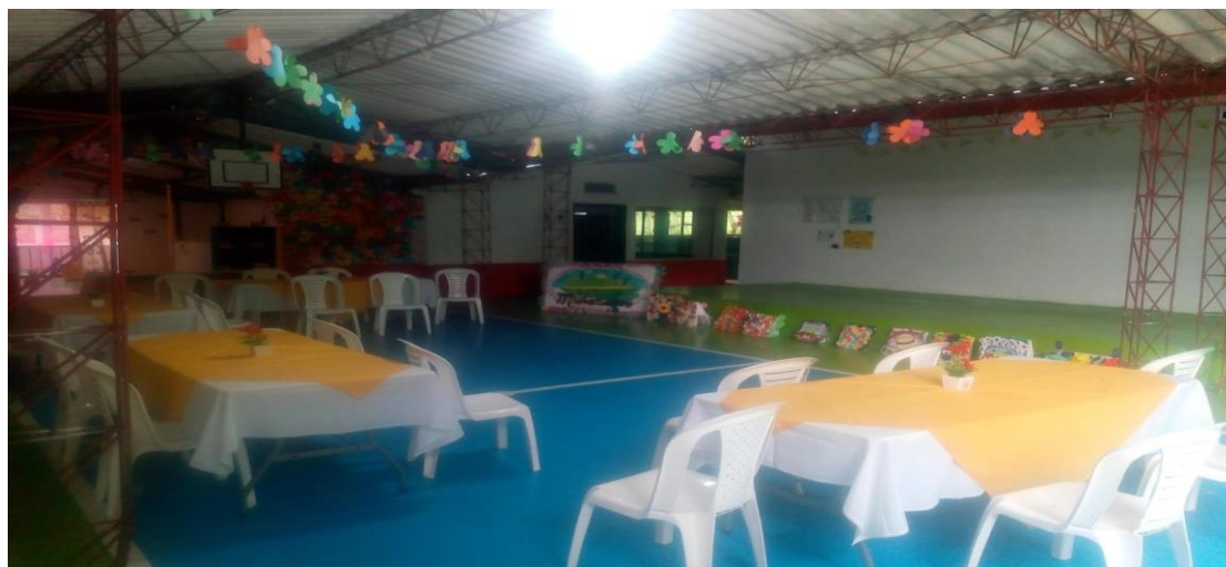
Ilustración 2. Cancha (2022)