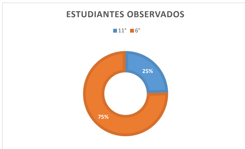
Figura 4 - porcentaje de alumnos observados 11° y 6°

Dentro de las observaciones se destaca la participación de 57 estudiantes de los cuales el 75%, es decir, 43 de ellos eran de 6°; mientras que el 25% restante, 14, eran de 11° (Ver figura 2: Porcentaje de estudiantes observados entre 11° y 6°), esto debido a que el mismo día de la aplicación de esta última observación se realizó la prueba de ingreso a la universidad, factor inesperado dentro de la aplicación. Un aspecto a destacar dentro de las observaciones es que en ambas se observa un contacto con el arte, esto permite abordar en su mayoría todas las categorías, mientras que se observan diferentes vivencias que parte de la forma en que el docente aborda la clase. Dentro de los resultados se va hacer énfasis en el arte y las experiencias formativas espirituales que proponen los docentes, es por eso que tendremos que referirnos a estos dos docentes con ciertos códigos, respecto a la docente de sexto se utilizará el código E6 y el docente de Once se utilizará C11. (Ver tabla 27: observación 1 y tabla 28: Observación 2)