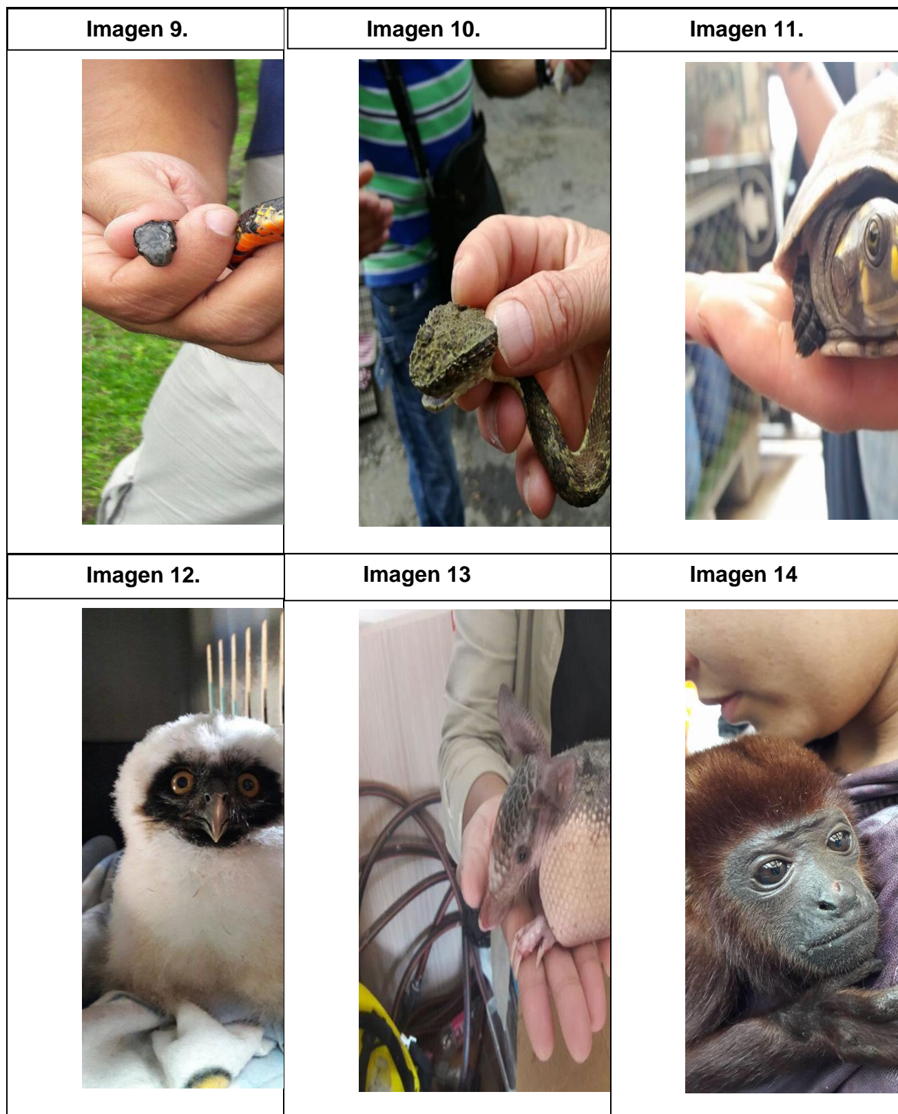
Tabla 3. Actividades con fauna silvestre.