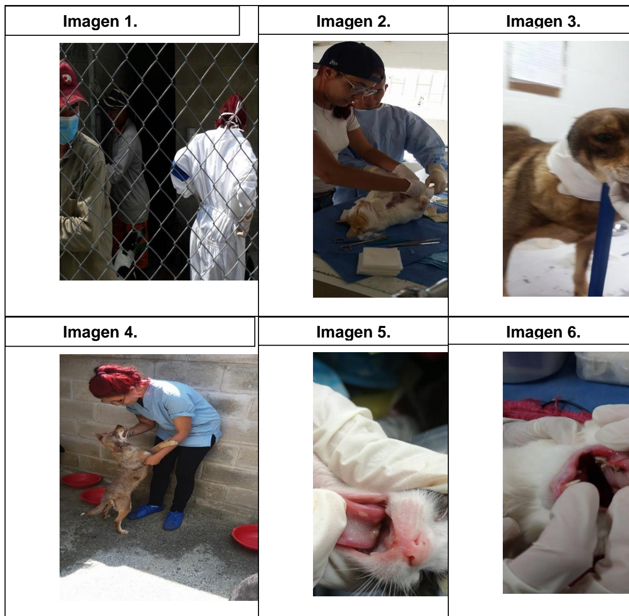
Tabla 1. Actividades en el albergue.