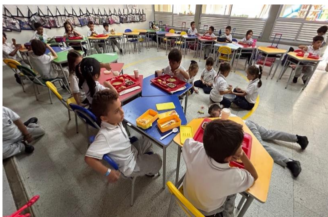
Ilustración 2. Momento de almuerzo niños y niñas

respondían de manera tranquila y feliz, expresando su conformidad con el almuerzo que habían traído de casa. Algunos expresaban lo felices que les hacía comer su comida favorita hecha por su mamá, mientras que otros compartían lo a gusto que se sentían comiendo en el salón con sus amigos. También había quienes preferían hacerlo en un espacio tranquilo, sin zapatos y con un mantel. Las respuestas variaban, pero cada una de ellas era muy valiosa. Este momento de interacción entre la maestra investigadora y los niños y niñas permitió que expresaran sus emociones y pensamientos relacionados con la comida y el ambiente en el que comían. Fue una oportunidad para que compartieran sus experiencias y preferencias, lo que contribuye a un ambiente de confianza y participación activa.