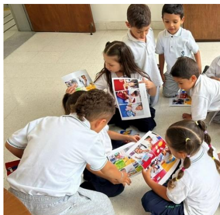
Ilustración 4. El último paso de toma de consciencia