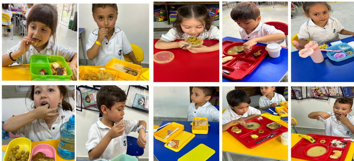
Ilustración 3 Promoción de la participación de los niños y niñas en las sesiones del taller de fotoimagen