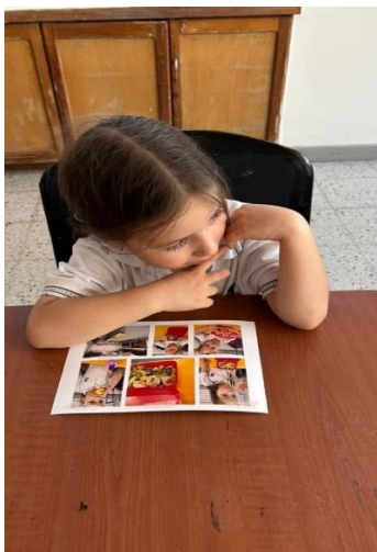
Ilustración 1. Trabajo de campo