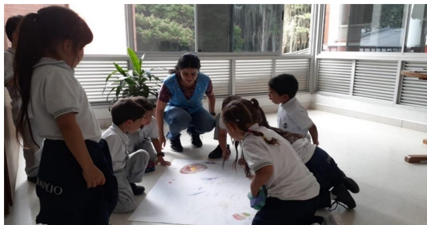
Ilustración 5. Proceso de construcción de estrategias para los momentos de alimentación de los niños y niñas.