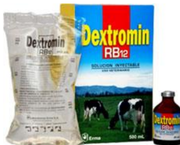
Ilustración 2. Principios activos