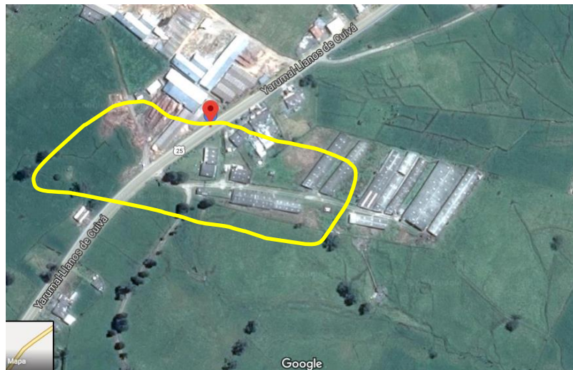
Ilustración 1. Ubicación de la granja

Procesos traumáticos como aplastamientos.