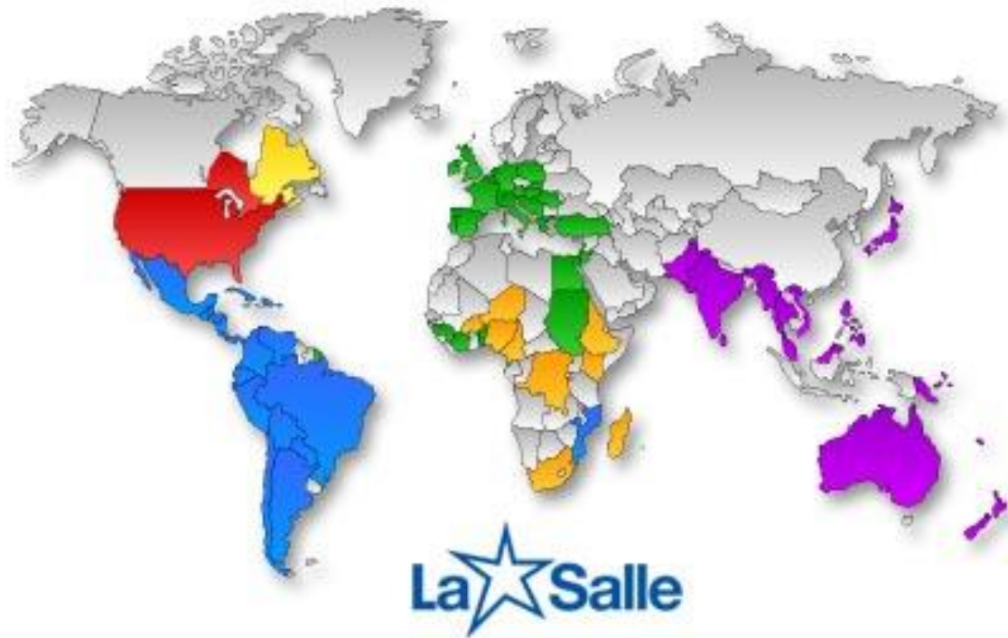
Ilustración 4. Mapa mundial con la ubicación de las respectivas regiones de La Salle