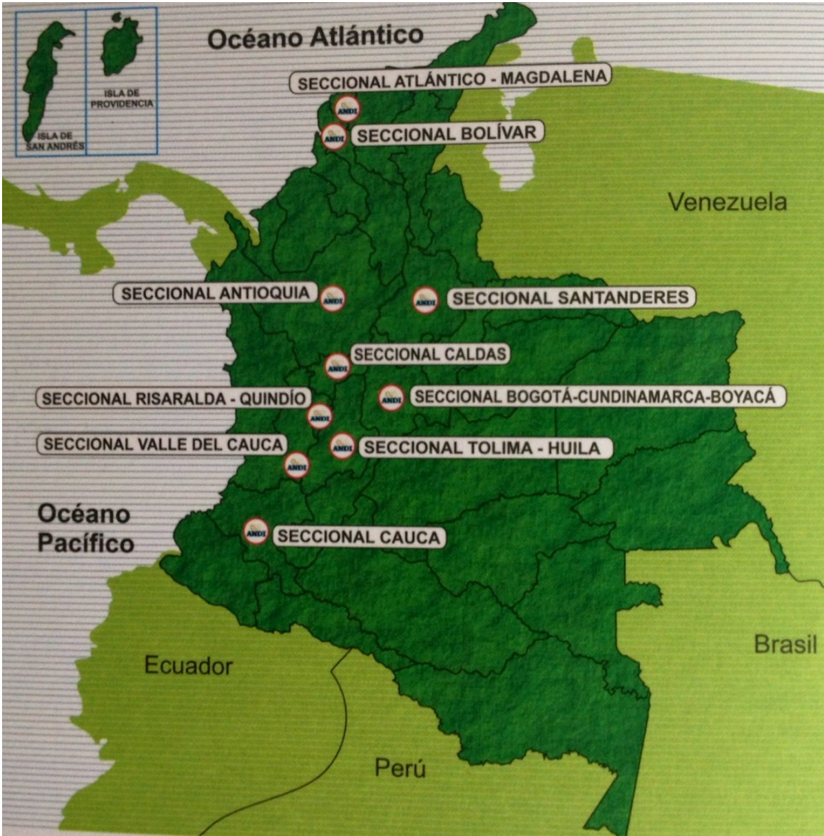
Ilustración 1. Presencia regional de la ANDI