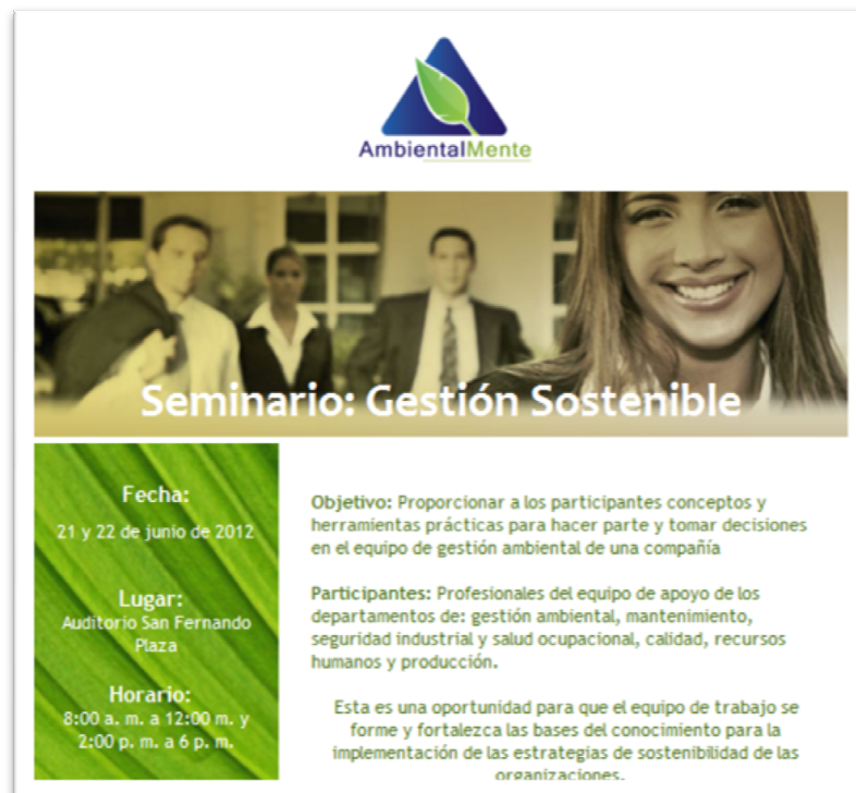
Ilustración 8. Seminario en Gestión Ambiental