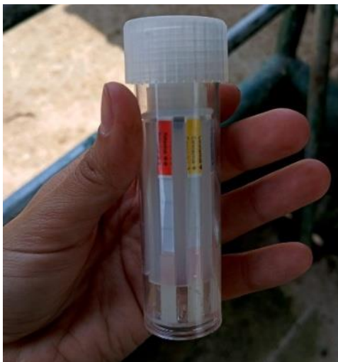
Ilustración 4. Resultado final prueba SNAP del CASO 2. Positivo para Rotavirus y Coronavirus.

Se realiza la toma de muestra fecal directa desde el ano del animal, se esperan los 10 min recomendados y luego se leen los resultados de cada tira de color. el resultado fue: positivo para Rotavirus y Coronavirus .