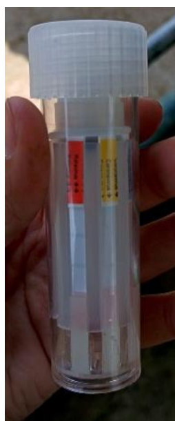
Ilustración 6. Resultado final prueba SNAP del CASO 2. Positivo para Rotavirus y Coronavirus.

Se realiza la toma de muestra fecal directa desde el recto el animal, se esperan los 10 min recomendados y luego se leen los resultados de cada tira de color. El resultado fue positivo para Rotavirus , Coronavirus , E. Coli (K99) y Cryptosporidium .