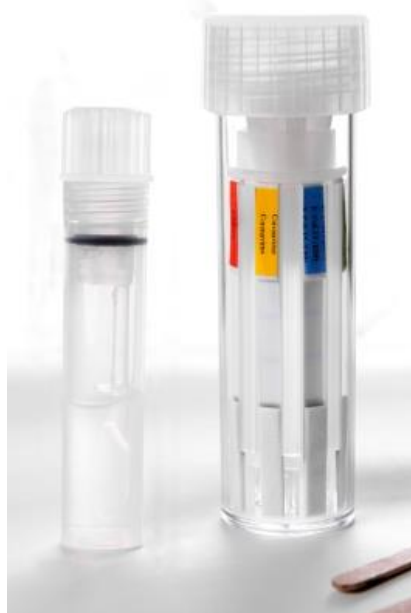
Ilustración 1. Rainbow CALF Scour. Prueba rápida para la detección de patógenos causales de Diarrea Neonatal Bovina (DNB) (BIO-X).

La prueba Rainbow Calf Scour ® es un método para identificar patógenos en terneros. Comienza inmovilizando al animal para obtener una muestra fecal directamente del recto. Una vez conseguida, la muestra se mezcla con un reactivo líquido en un tubo durante dos minutos. Luego, se introduce este tubo en el dispositivo de prueba, asegurándose de enroscarlo hasta que se escuchen dos clics que confirmen que esté bien conectado. El dispositivo se deja reposar en posición vertical por 10 minutos para que el líquido migre por las tiras reactivas. Finalmente, se leen los resultados: cada tira que cambia de color señala la presencia de un patógeno distinto (BIO-X):