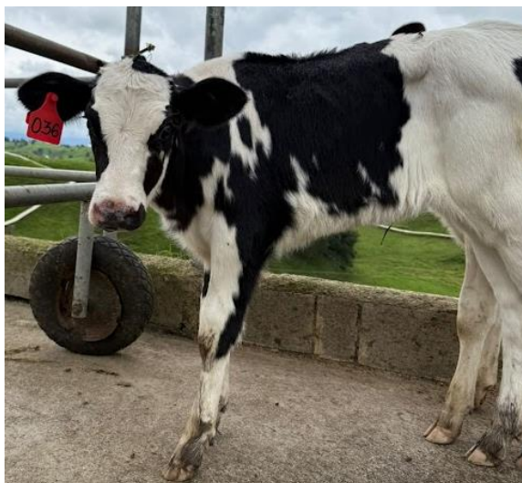
Ilustración 8. Paciente CASO 3. Ternera Holstein.