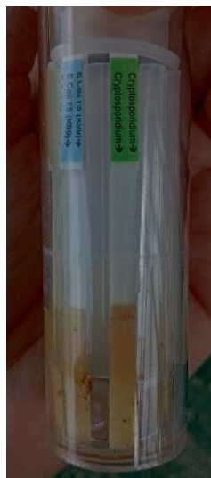
Ilustración 7. Resultado final prueba SNAP del CASO 2. Positivo para Cryptosporidium y E. Coli (K99).