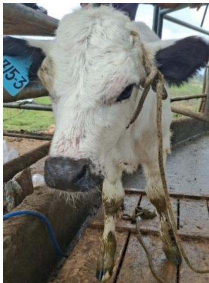
Ilustración 5. Paciente CASO 2. Ternera "BON".