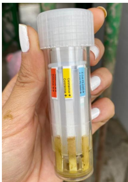
Ilustración 9. Resultado final prueba SNAP del CASO 3. Positivo para Coronavirus.

Se realiza la toma de muestra fecal directa desde el ano del animal, se esperan los 10 min recomendados y luego se leen los resultados de cada tira de color. El resultado fue positiva para Coronavirus .