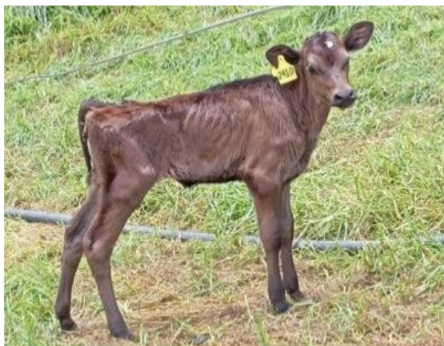
Ilustración 3. Paciente CASO 1. Ternera “Jerhola”.

Se inspecciona el entorno a distancia, donde se evidencia un espacio en donde las demás terneras están bajo techo de plástico y baretas de madera, pero sin puertas ni paredes, permitiendo así la entrada de corrientes de aire frías. La inspección de los bebederos y comederos se realizó de manera efectiva, para asegurar la sanidad de estos y verificando que el concentrado Manná Pellet® estuviese en condiciones óptimas para la ingesta. Al momento de la consulta, la paciente presenta normotérmica, con una FC de 100 lpm, la FR de 40 rpm y el tiempo de llenado capilar retardado (>2 seg). Su estado mental es deprimido, apática, con una deshidratación del 7%, con baja condición corporal (2/5) y presenta heces de textura blanda con trazas de sangre en poca cantidad.