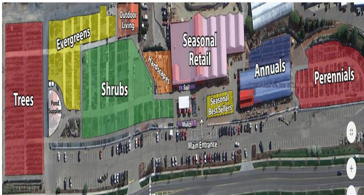
Figura 2. Distribución de planta compañía Gertens Greenhouses