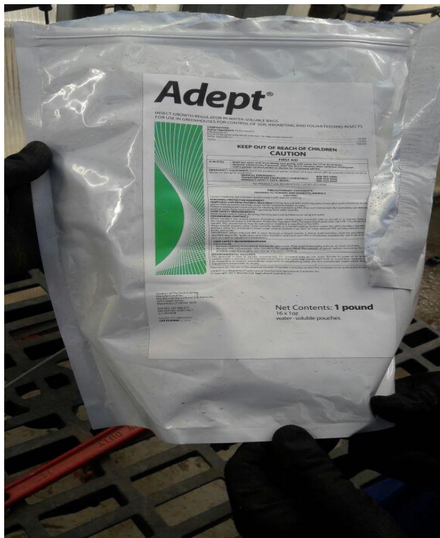
Foto 11. Agroquímicos

Fuente: http://www.gertens.com/atgertens