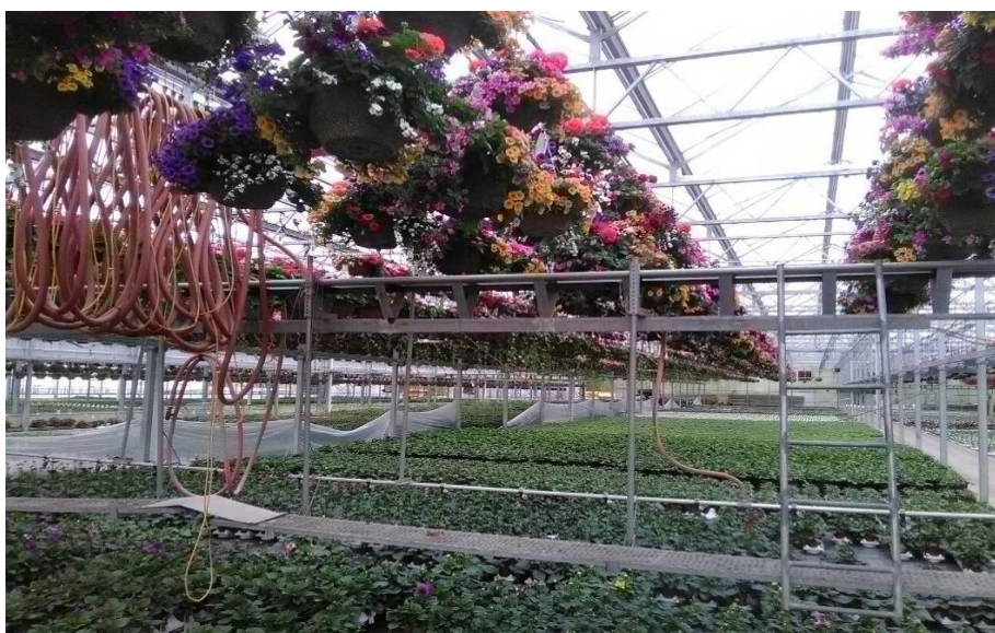
Foto 6. Línea de riego

Fuente: http://www.gertens.com/atgertens