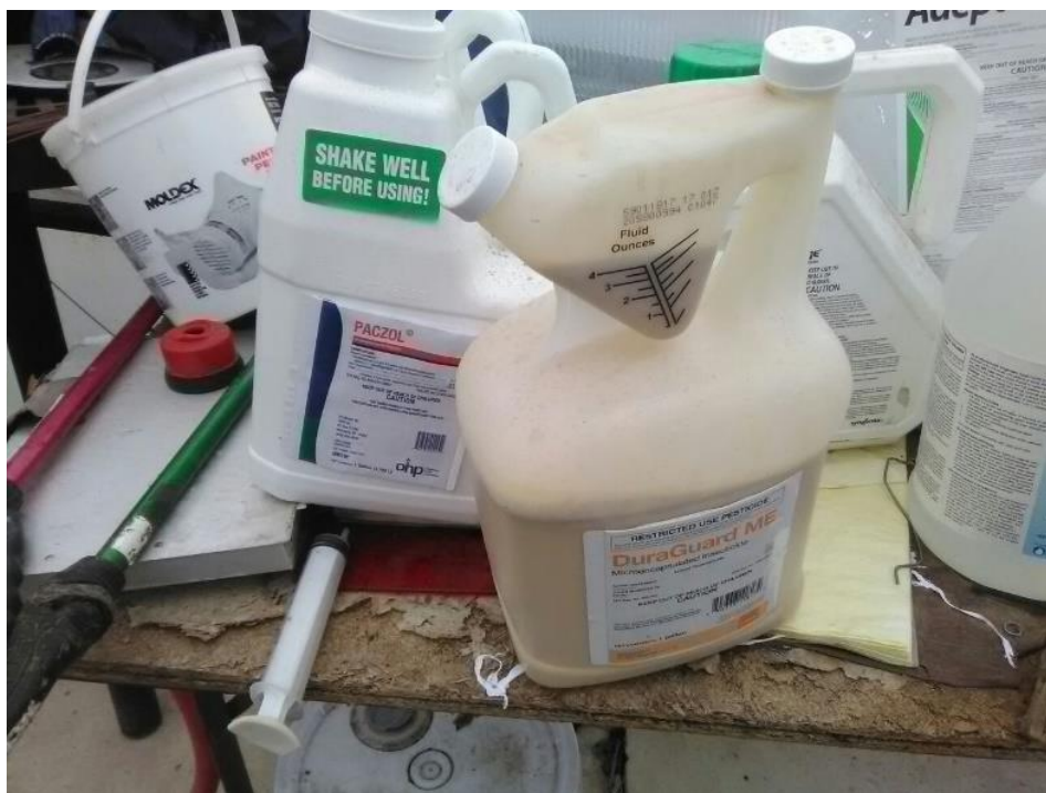
Foto 10. Agroquímicos

Fuente: http://www.gertens.com/atgertens