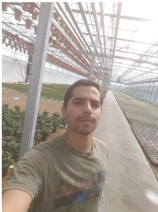
Foto 5. Descargue de plantas provenientes de la línea de producción