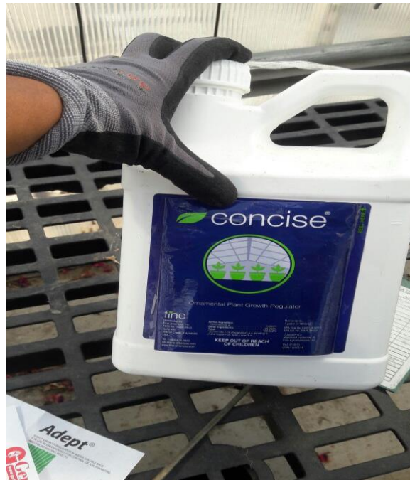
Foto 12. Agroquímicos