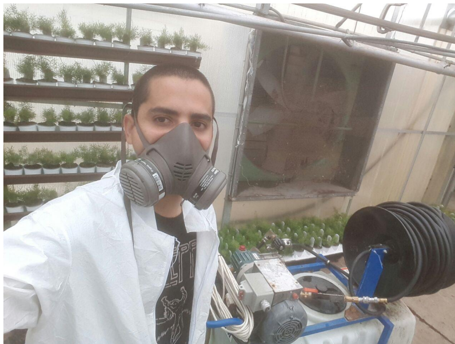
Foto 13. Aplicación de Fungicidas

Fuente: http://www.gertens.com/atgertens