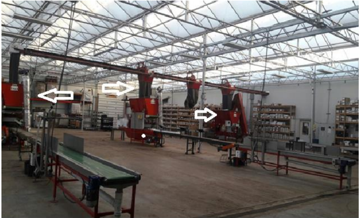
Foto 1. Línea de montaje

Fuente: http://www.gertens.com/atgertens