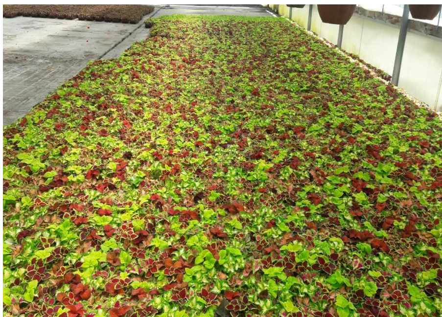
Foto 8. Cultivo coleos

Fuente: http://www.gertens.com/atgertens