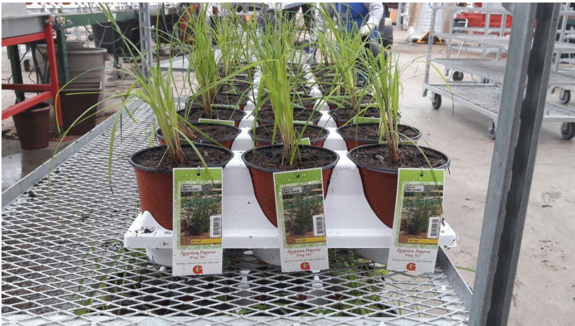
Foto 3. Cargue de producto

Fuente: http://www.gertens.com/atgertens