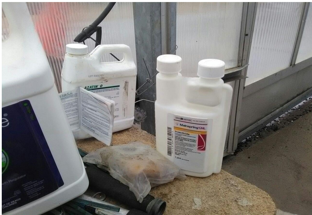
Foto 9. Agroquímicos

Fuente: http://www.gertens.com/atgertens