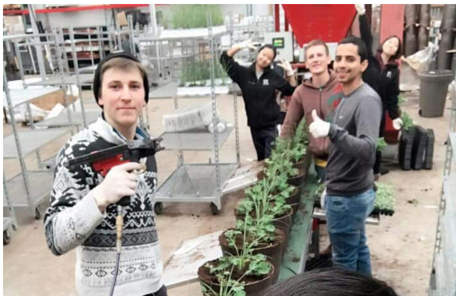
Foto 4. Operaciones de trasplante en la línea de producción

Fuente: http://www.gertens.com/atgertens