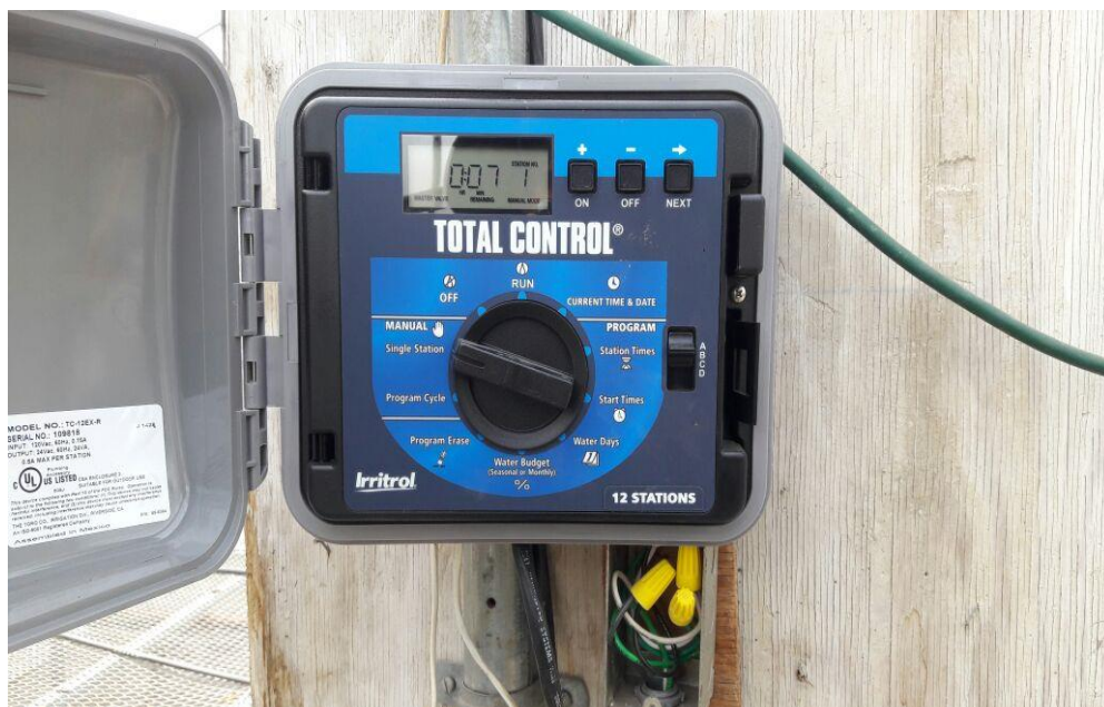
Foto 7. Panel de irrigación

Fuente: http://www.gertens.com/atgertens