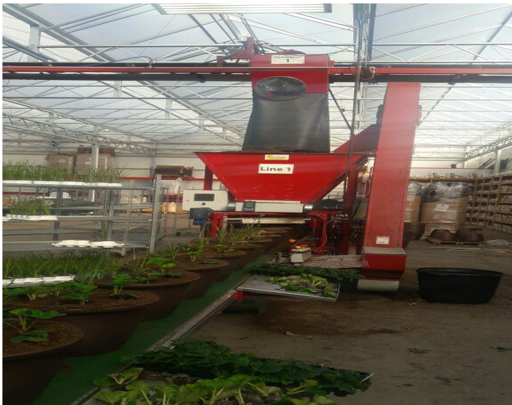
Foto 2. Línea en producción

Fuente: http://www.gertens.com/atgertens