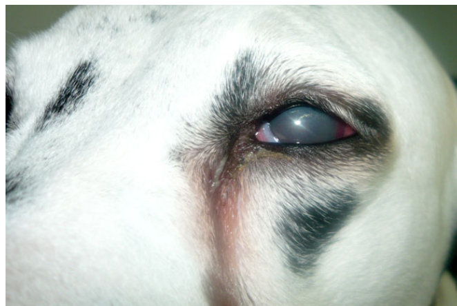
Figura 1. Paciente con anillo periquerático, blefarospasmo y epifora

especializada en el área de oftalmología. El paciente presentaba signos de dolor ocular (blefarospasmo, fotofobia y epifora), prolapso del tercer párpado, enrojecimiento ocular y pérdida de la visión del ojo izquierdo, con evolución de 1 semana y reporte anamnésico de masa a nivel intraocular diagnosticada varios años atrás (figura 1).