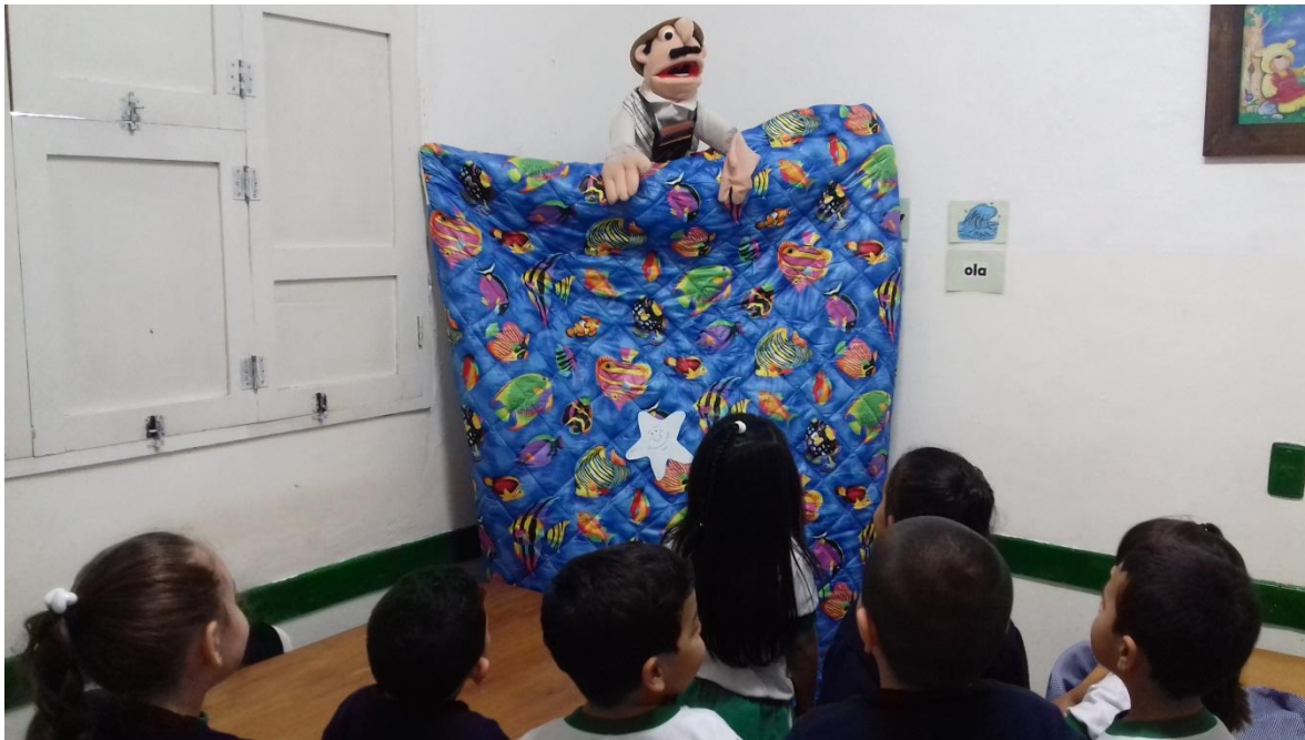
Ilustración 1. Títeres