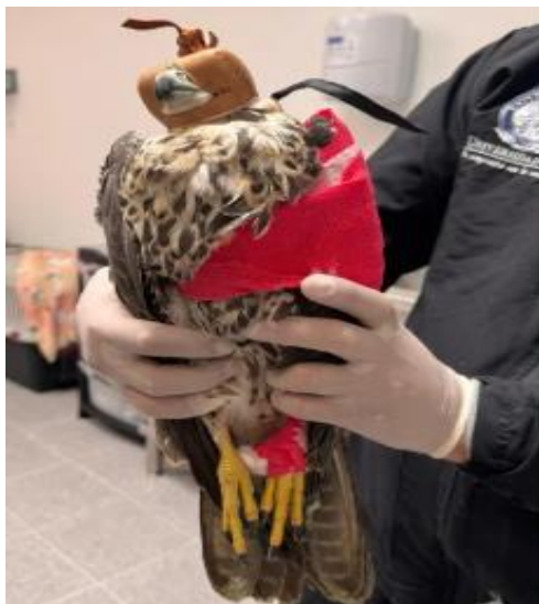
Ingreso del halcón peregrino al CAVR

Nota: Fotografía del individuo al ingreso al CAVR.