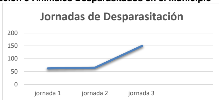
Ilustración 3 Animales Desparasitados en el Municipio

Durante el periodo de práctica se realizaron 3 jornadas de desparasitación. En el tiempo en cuestión, la participación de la comunidad creció significativamente, pues en la primera jornada de desparasitación se contó con una asistencia de 62 mascotas distribuidos en 30 caninos y 32 felinos. Para los animales de esta jornada no se tienen datos ya que a la fecha no se tenía un plan de trabajo para tabular información como el sexo, edad de mascotas y propietarios y otros de ubicación como el barrio de residencia.