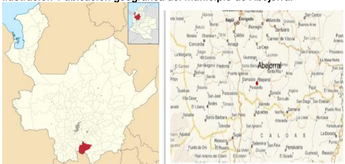
Ilustración 1 ubicación geográfica del municipio de Abejorral