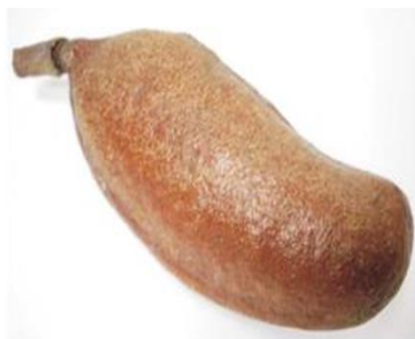
Figura 2. Vaina de la Algarroba

(enfermedad que se caracteriza por una afección del sistema inmunitario en la que las personas no pueden consumir gluten, proteína presente en la mayoría de los cereales, su ingesta puede causar daño en el intestino delgado (MedlinePlus, 2019). En las figuras de la 2 a la 5 se muestra el fruto de la algarroba en diferentes formas: