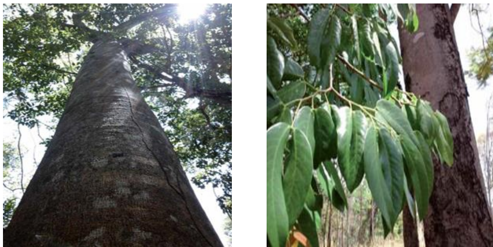
Figura 1. Árbol y corteza del algarrobo