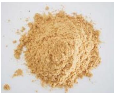
Figura 3. Pulpa del Algarroba

Fuente. (Alzate, Arteaga, & Jaramillo, 2008)