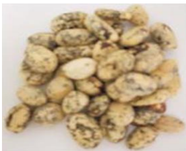
Figura 4. Semilla de Algarrobo sin lavar

Fuente. (Alzate, Arteaga, & Jaramillo, 2008)