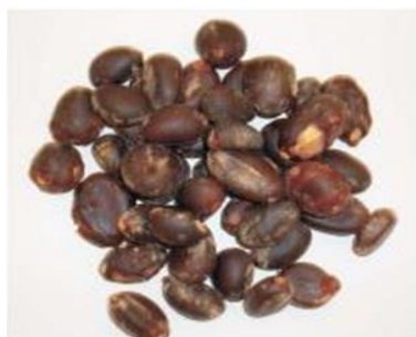
Figura 5. Semillas del Algarrobo lavadas