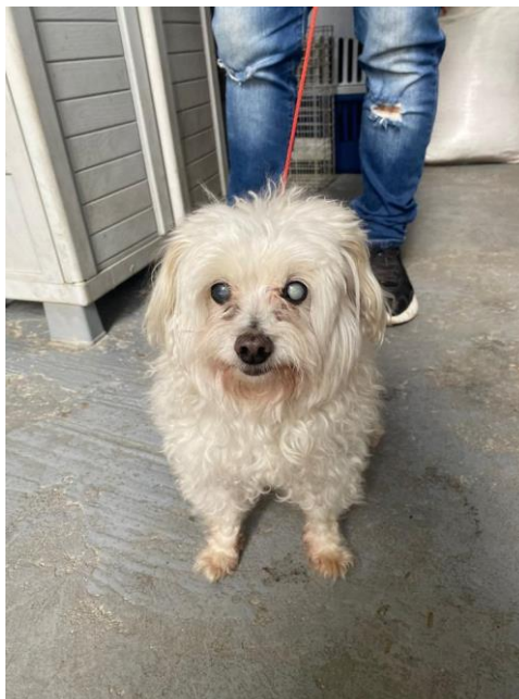
Ilustración 2 Atención de paciente por atropellamiento