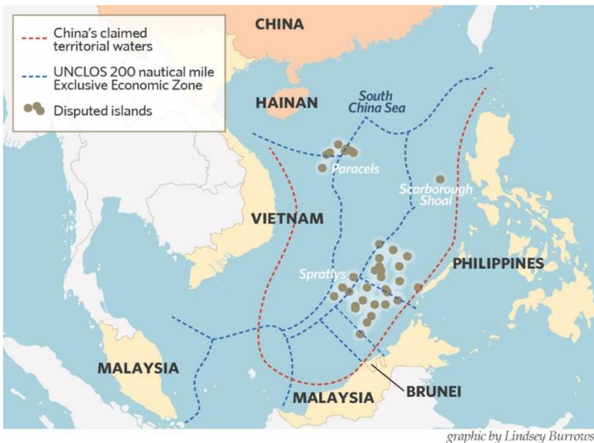
Ilustración 2 Mapa 2: Grupos de islas y zonas náuticas dentro de la línea de nueve puntos.

Lombok estos tres estrechos dan paso al Mar del Sur de China y por lo menos un tercio del crudo global y la mitad del gas natural del mundo pasa por estos estrechos convirtiendo la zona en una de las más navegadas del mundo. Esto permite ilustrar la alta importancia de esta extensión marítima, y los conflictos que surgen a raíz de los recursos económicos y marítimos de la zona.