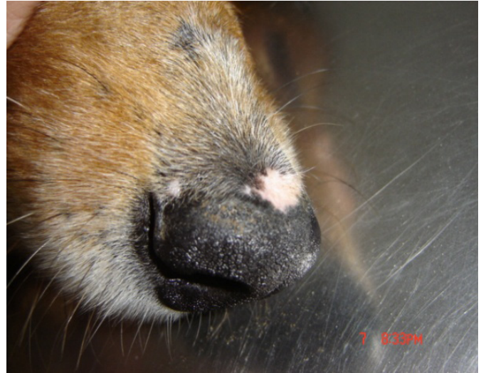
Figura 4. Paciente después de un mes con terapia inmunosupresora con Prednisolona

Al mes se presenta a revisión, y se encuentra una evolución satisfactoria del cuadro clínico (ver figura 4).