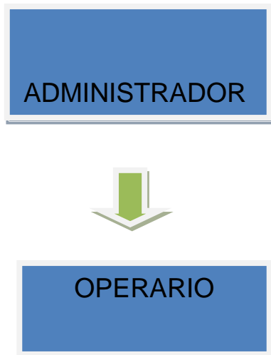
Imagen 3: Organigrama

que tenga experiencia ya sea en el campo de los bovinos y ser una persona atenta y responsable en todos sus deberes.