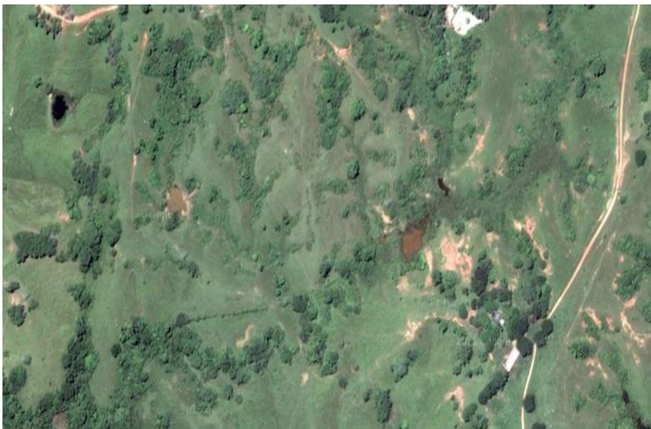
Imagen 2: Terreno de la explotación

El área destinada para la producción de carnero será aproximadamente de 10 ha en pasto, su ubicación se encuentra en el kilometro 5 de Caucaasia-Antioquia cercana a la vereda campo alegre, a continuación el mapa de la finca.