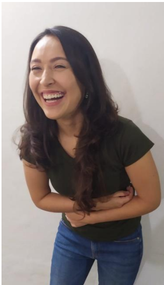
Fotografía 1. Ejemplo

Guíe la aplicación de los reactivos siguientes, teniendo en cuenta las instrucciones presentadas con anterioridad.