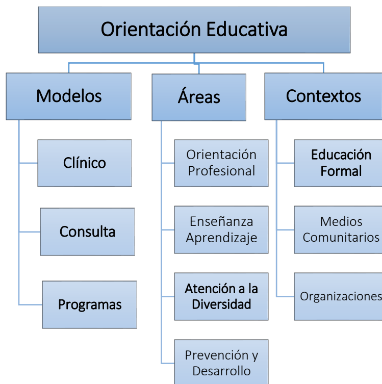
Ilustración 1. Modelo de Orientación Educativa según Rafael Bisquerra (1996).

Tradicionalmente la educación especial ha estado ligada a la deficiencia y por lo tanto al estudio de las diferencias, no como manifestación de la diversidad humana sino como algo específico de una minoría o grupo.