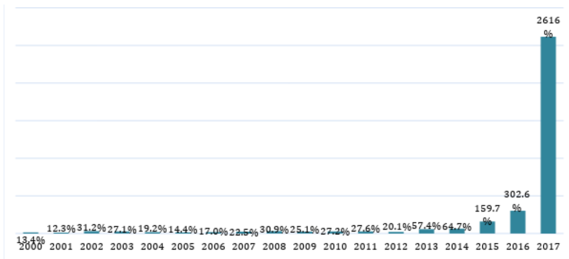
Gráfico 2: tasa de inflación acumulada en venezuela