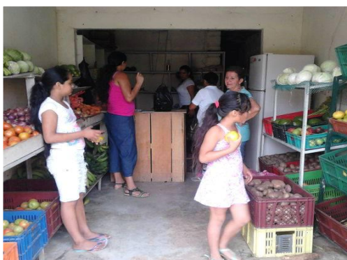
Clientes de la legumbrería central, en el municio de vegachí

A la salida de la legumbrería unos clientes files a esta me dijeron que sus productos eran bastantes buenos, sobre todo la yuca, también de la buena atención que se brinda en este lugar.