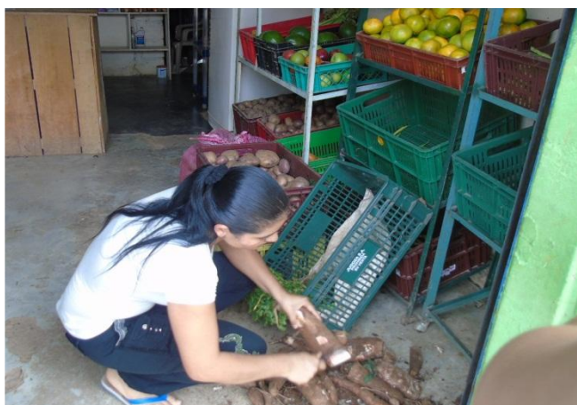
Propietaria de la legumbreteria central de vegachí