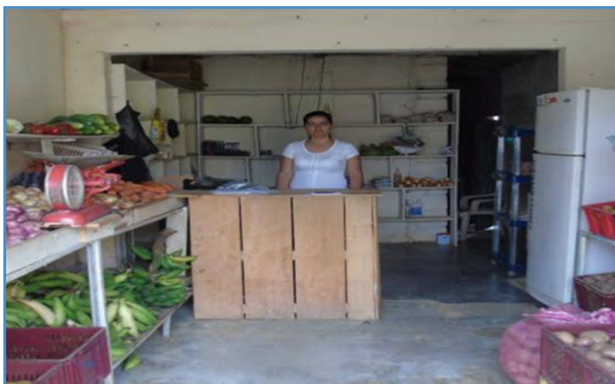
Legumbreteria central de vegachí, con su propietaria.