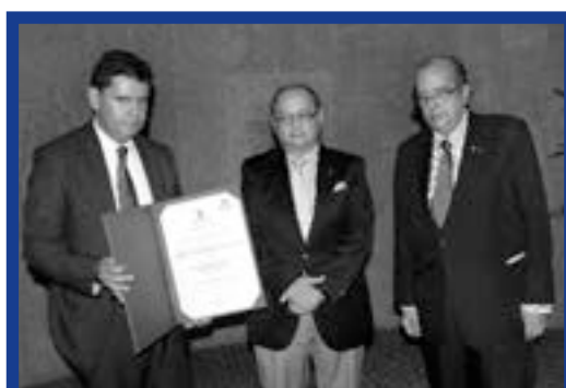
El Rector de la Corporación y el Presidente de ALDEA recibieron el reconocimiento concedido por la Alcaldía de Medellín

En el marco de la conmemoración, la alcaldía de Medellín concedió a la Institución la Medalla "Al Mérito Educativo y Cultural Porfirio Barba Jacob", Categoría Plata. Igualmente, se sumaron a la ceremonia con diversas manifestaciones de felicitación la Gobernación de Antioquia, la Asociación Lasallista de Exalumnos ALDEA, el municipio de Caldas, la Cámara de Comercio Aburrá Sur, los colegios lasallistas e instituciones de educación superior.