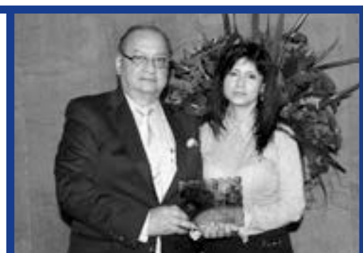
El Rector de la Corporación y la Rectora del Instituto San Carlos

En el marco de la conmemoración, la alcaldía de Medellín concedió a la Institución la Medalla "Al Mérito Educativo y Cultural Porfirio Barba Jacob", Categoría Plata. Igualmente, se sumaron a la ceremonia con diversas manifestaciones de felicitación la Gobernación de Antioquia, la Asociación Lasallista de Exalumnos ALDEA, el municipio de Caldas, la Cámara de Comercio Aburrá Sur, los colegios lasallistas e instituciones de educación superior.