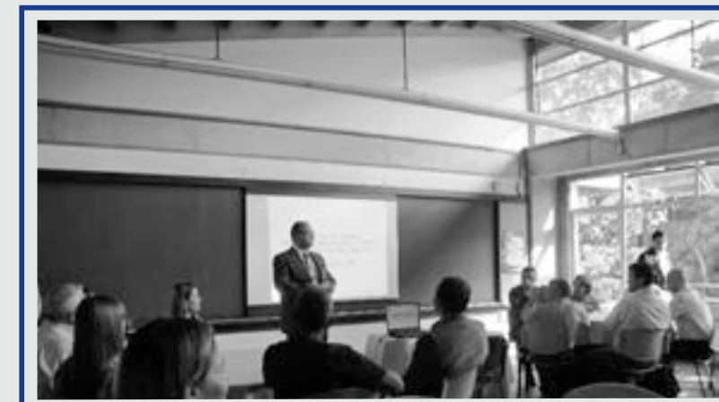
Actividad de la Mesa Sectorial Agropecuaria y Agroindustrial de Caldas

La Mesa Sectorial Agropecuaria y Agroindustrial de Caldas tiene como propósito trabajar en función del sector agropecuario, para aprovechar su potencial y mejorar su situación actual, mediante la formulación y ejecución de proyectos. Este grupo de trabajo, que lleva dos años operando, es un espacio que busca orientar y articular la gestión del Estado y los actores sociales en sus diversas competencias, para lograr un desarrollo rural equitativo, sostenible, competitivo, participativo y democrático en el municipio.