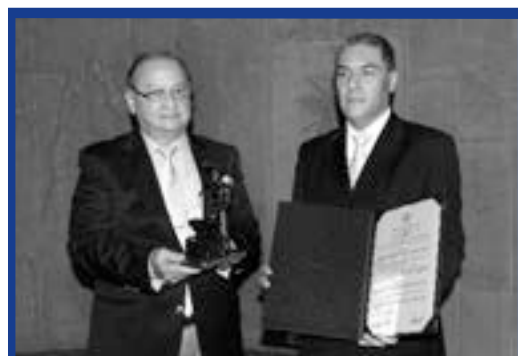
El Rector de la Corporación recibe la distinción concedida por la Cámara de Comercio Aburrá Sur

La Corporación conmemoró sus 30 años de fundación con un acto protocolario que se llevó a cabo el 29 de mayo de 2012, el cual contó con la participación de estudiantes, docentes, personal administrativo y de servicios generales, fundadores e invitados especiales. En el evento se exaltó el compromiso de los estudiantes, docentes y colaboradores, quienes disfrutaron de un concierto de los Grupos de Cámara de la Orquesta Sinfónica EAFIT.