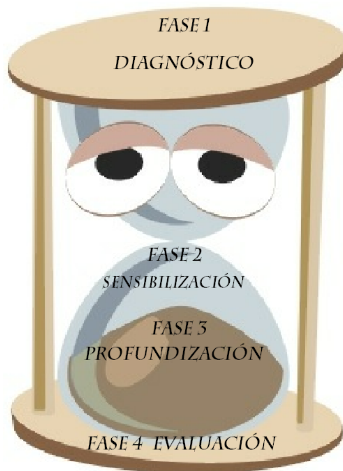
Ilustración 2 esquema del modelo de metodología