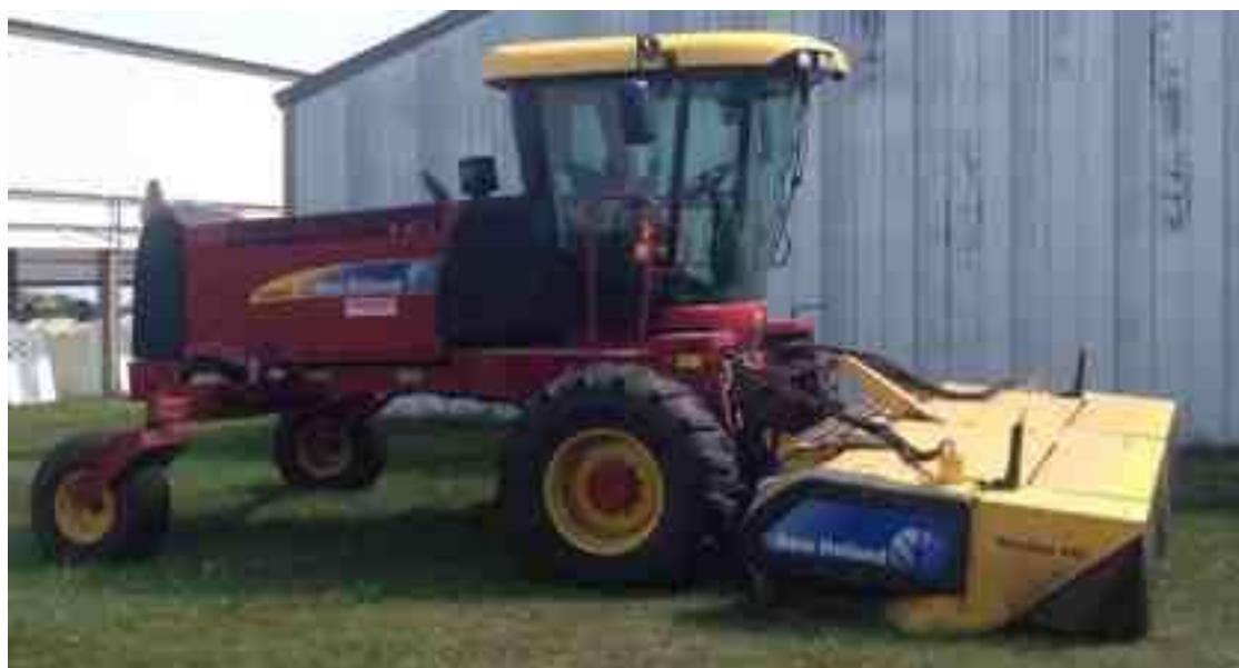
Ilustración 11. Cortadora de heno New Holland H8060