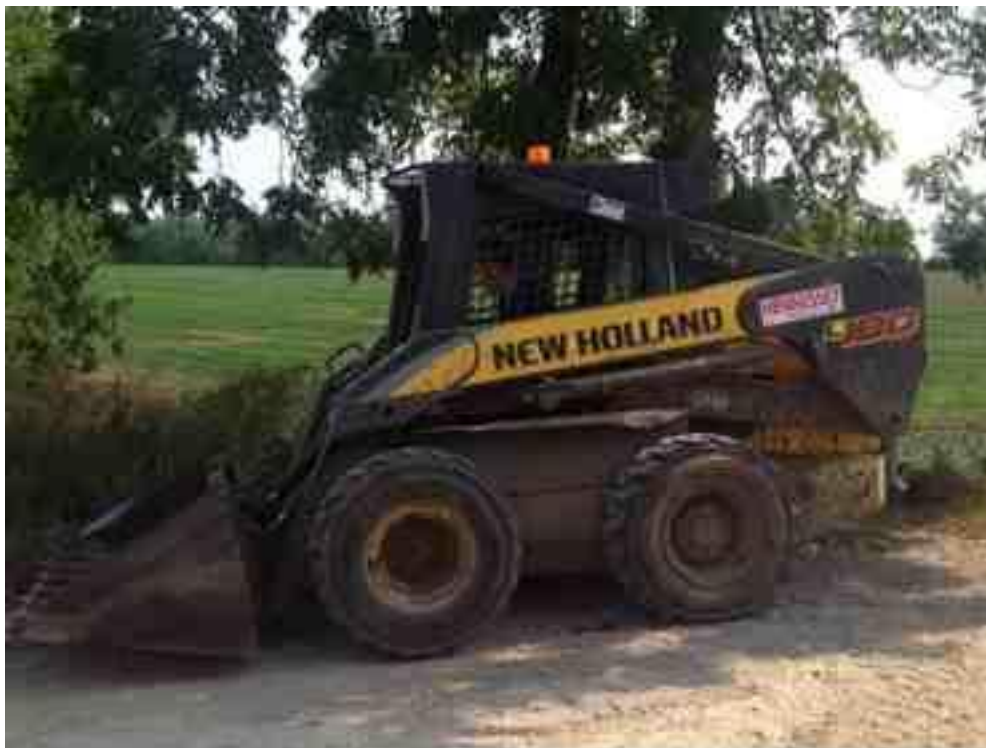
Ilustración 7. Skid loader New Holland 180.

La finca cuenta con su propia maquinaria para la operación, a continuación se encuentra una lista de la maquinaria presente: