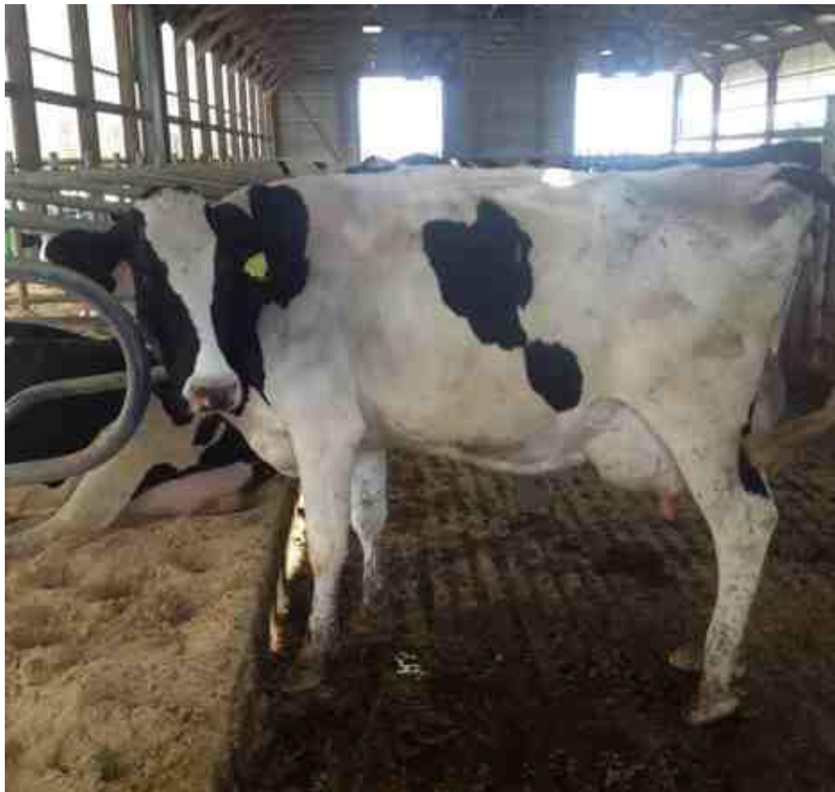
Ilustración 5. Vacas en ordeño

reemplazo cuentan con una condición corporal de 4 en promedio ya que cuentan con una alimentación de alta calidad.