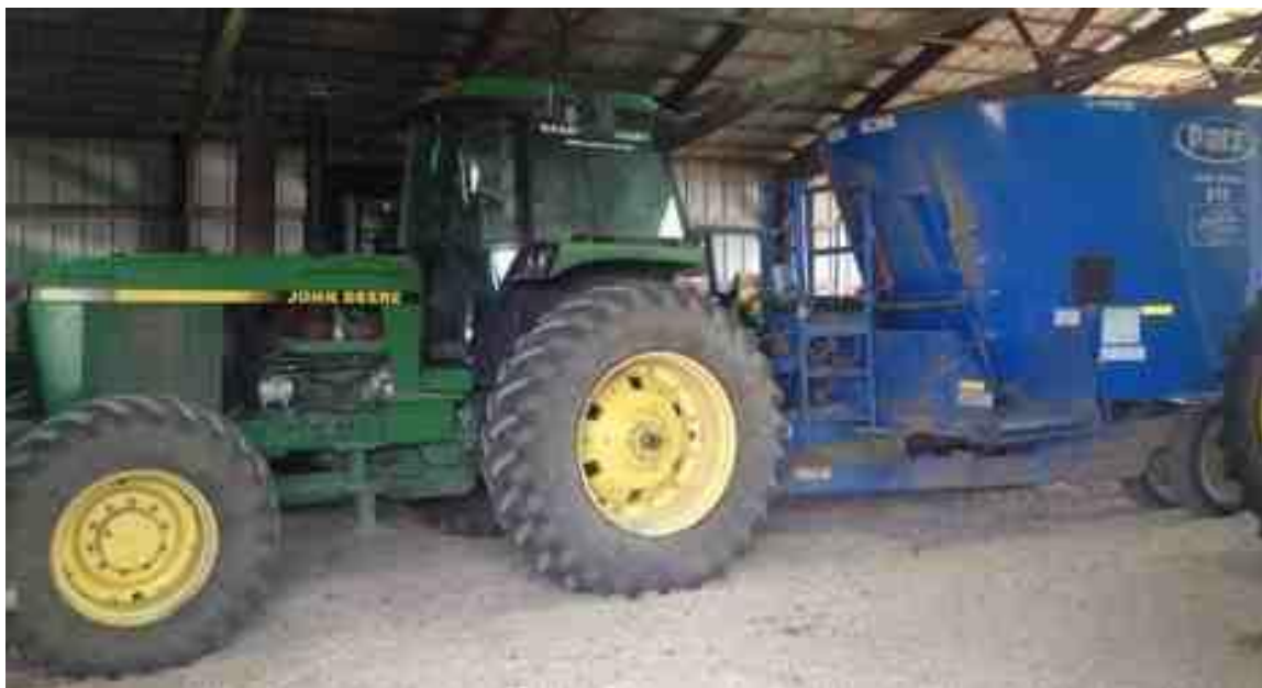
Ilustración 10. Tractor John Deere 4255 y mixer para el alimento.