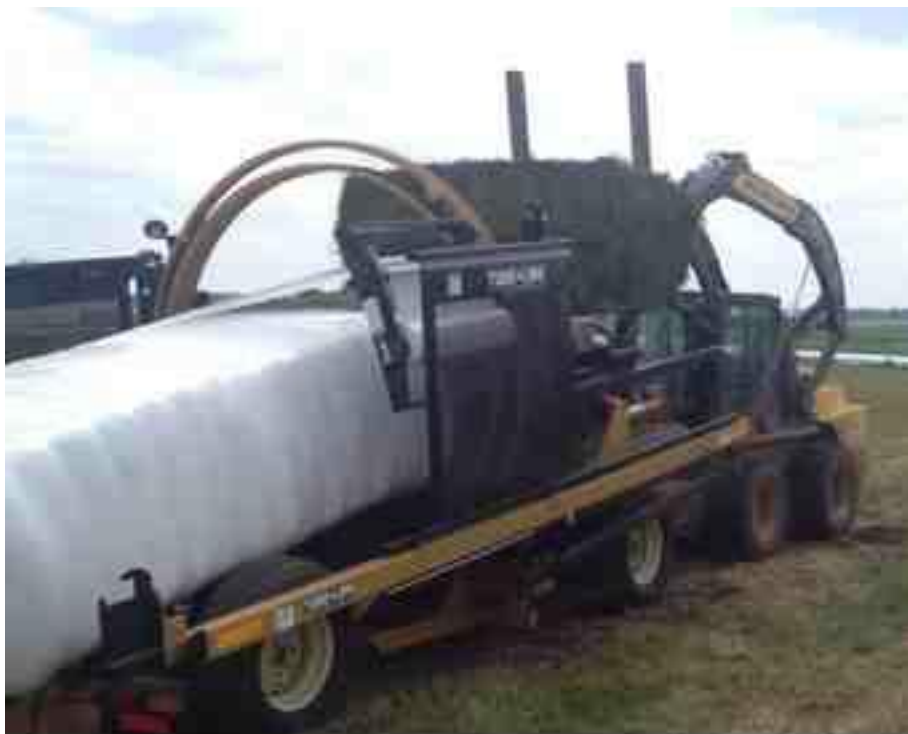
Ilustración 12. Wrapper o empacador de heno Tube Line TL5500

Con el wrapper lo que se hace es empacar el heno en un plástico especial para que conserve su calidad nutricional en la temporada de invierno ya que el frío no permite que el alimento se desarrolle en la tierra y hay que almacenarlo.