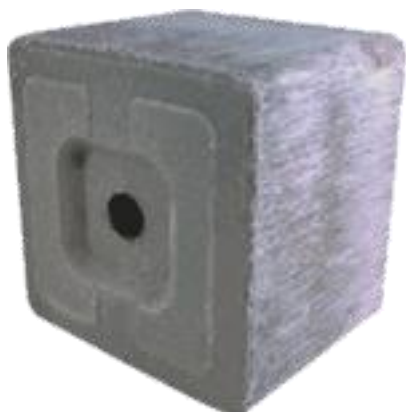
Ilustración 4. Sal mineralizada en bloque.

La finca no cuenta con disponibilidad de forraje en su pastura ya que la mayor parte del año hay un clima frío lo cual no permite el desarrollo de pasturas. Los suplementos y la sal mineralizada son suministradas en los comederos en una presentación de bloque nutricional en una cantidad de un bloque por cada 100 vacas, el cual tiene una duración de 15 días aproximadamente.