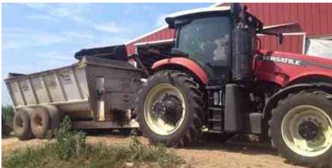
Ilustración 8. Tractor Versatile 360 y sepreader

Con el skid loader se realizan diferentes tipo de tareas como limpiar los establos para recoger las heces de las vacas que se encuentran estabuladas, para ser esparcidas en los campos para la fertilización y también es utilizado para realizar labores varias en la finca como cavar, esparcir el alimento de las vacas, poner arena en los establos, etc.