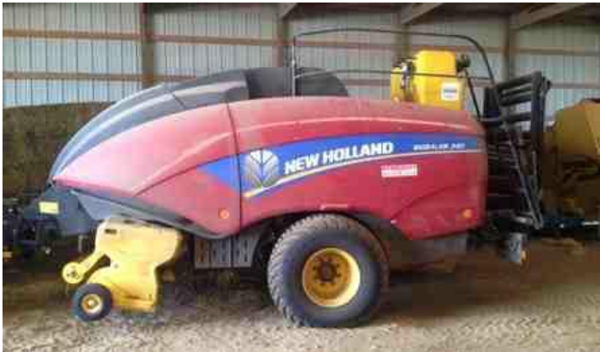
Ilustración 9. Empacador de heno NeW Holland big baler

Con este equipo se realiza la recolección del heno de alfalfa que se encuentra en el campo y por medio de su mecanismo convierte el heno recogido en pacas cuadradas para su almacenamiento.