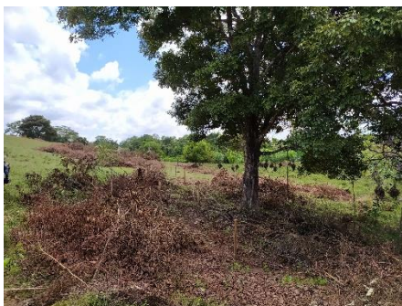
Ilustración 2 Limpieza de potrero