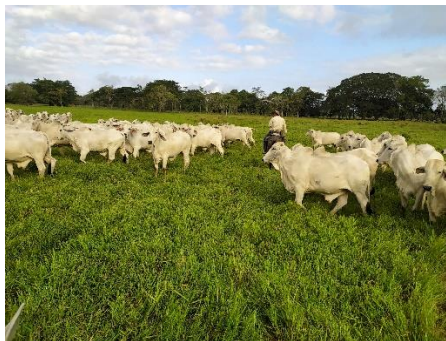
Ilustración 6 Ganado pastando

También cabe mencionar que si se tiene un ganado de calidad este ganara un promedio de 1 kilogramo al día lo que significa que estos novillos estarán en la finca solo de 6 a 8 meses lo que hace que la rotación de ganado sea muy rápida y el flujo de dinero también.