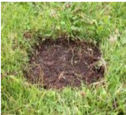
Ilustración -3. Pasos para la obtención de muestra