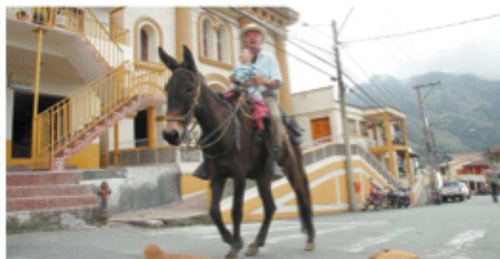
Con el aumento de la construcción de la carretera al mar, muchas familias se desplazaron a la parte alta del corregimiento y empezaron a poblar lo que ahora se conoce como la centralidad.

Fundado como San Sebastián de la Aldea y más tarde conocido como Palmitas, este corregimiento con 269 años de historia busca reflejar la cultura campesina atrayendo al turismo.