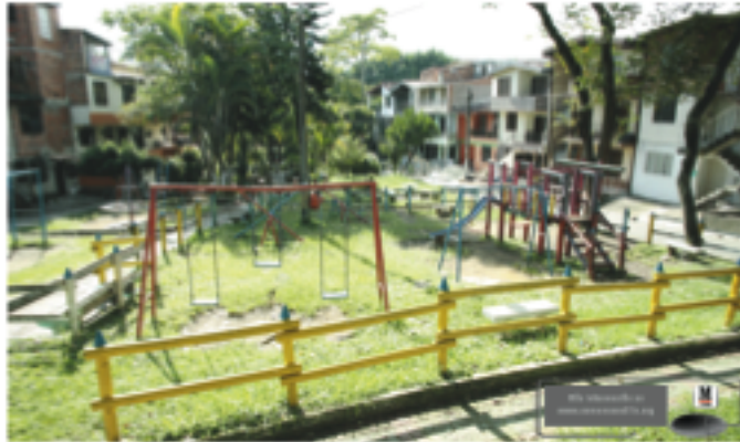
Uno de las características del barrio que más atrae a sus habitantes son sus áreas verdes y de recreación, que son aprovechadas por personas de toda la ciudad.

Con la llegada de colonos y urbanizadores también llegó la Estación de Policía Carabineros Las Brisas, sitio de formación de los nuevos contingentes de uniformados a caballo. No es coincidente que, según cálculos de los mismos habitantes, la mitad de las familias del barrio estén conformadas por agentes del Estado.