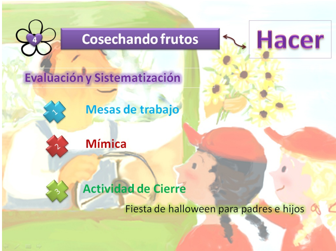
Grafica 8 Etapa del Hacer "Cosechando frutos"