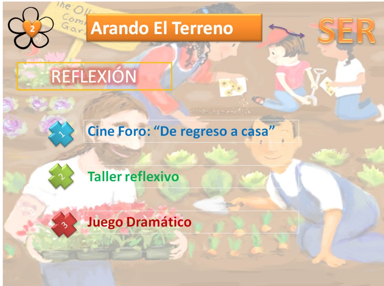
Grafica 6 Etapa del ser "Arando el terreno"