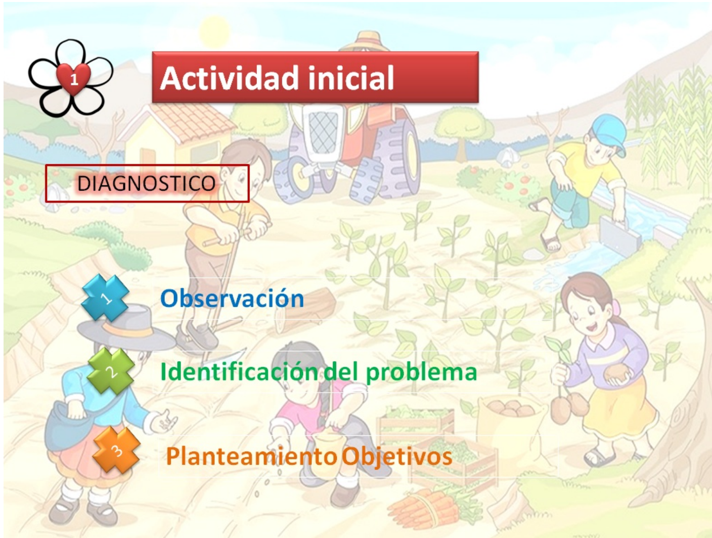
Grafica 5 Actividad Inicial "Diagnostico"