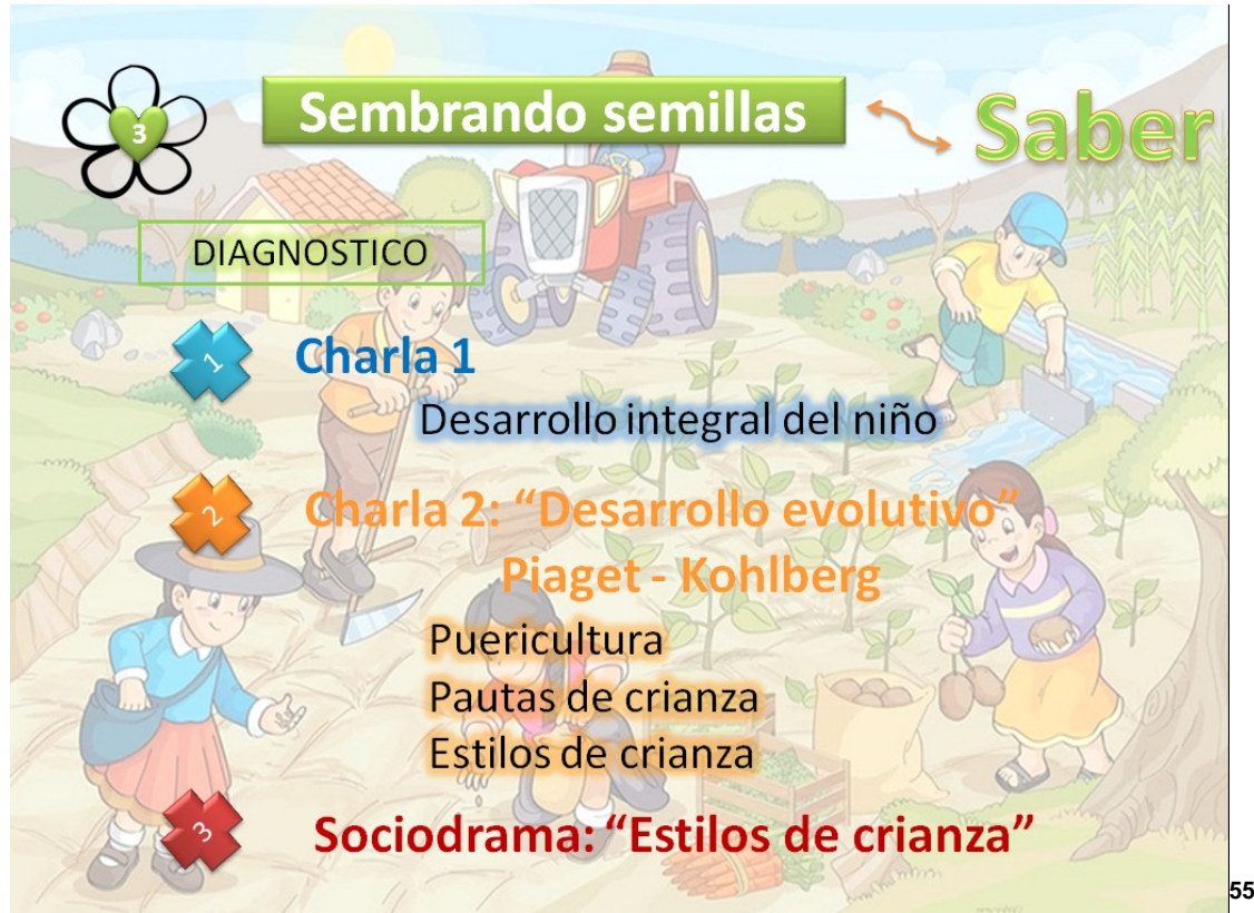
Grafica 7 Etapa del Saber "Sembrando semillas"