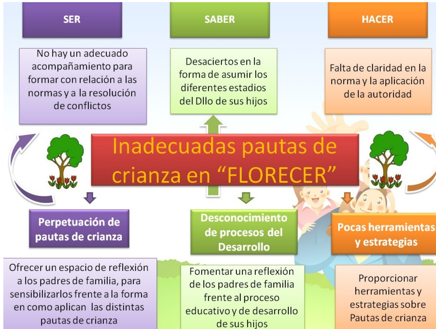
Grafica 1 Árbol de problemas