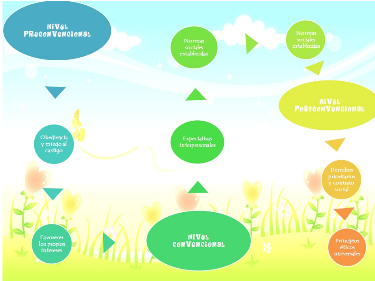
Grafica 3 Moral Kohlberg