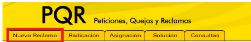
Imagen 15 – Formulario para ingresar nuevo reclamo