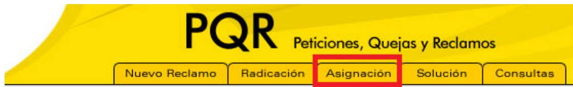
Imagen 3 – Pestaña asignación PQR