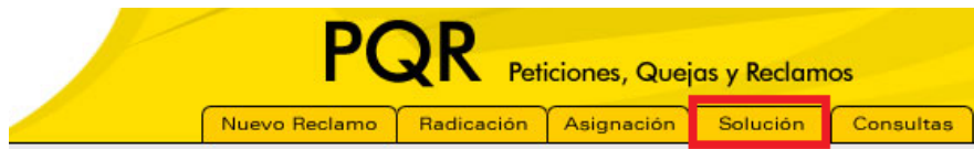
Imagen 5 – pestaña solución