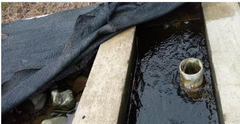
Ilustración 3. Filtro del almacenamiento de agua.

Los tratamientos establecidos por los operarios se dividen en 3 etapas: