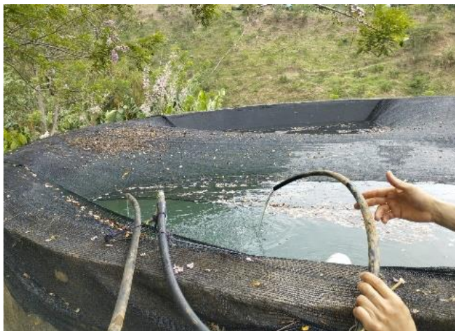
Ilustración 2. Tanque de almacenamiento de agua.