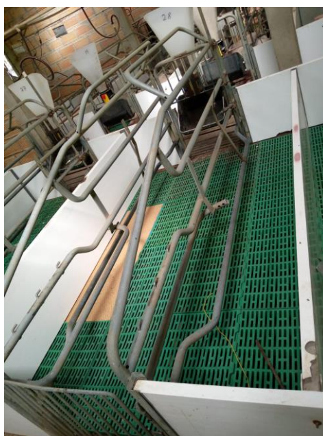
Ilustración 1. Parideras de la granja.

La infraestructura de las parideras tiene las siguientes medidas: las cerdas cuentan con un largo de 2,55 m, un ancho de 1,60 m, altura 1 m, el espacio de la cerda es de 78 cm, una entrada de 56 cm, un espacio para los lechones de 0.40 m en cada lado, la distancia del agua del piso está a 46 cm y del comedero a 22 cm.