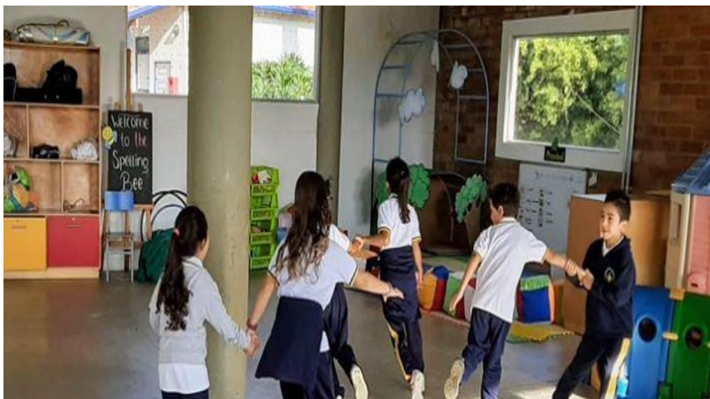
Ilustración 4: Aprendizajes R.I

“Profe y si jugamos uno grande con uno chiquito” (Pregunta de una niña de 7 años, 2019).