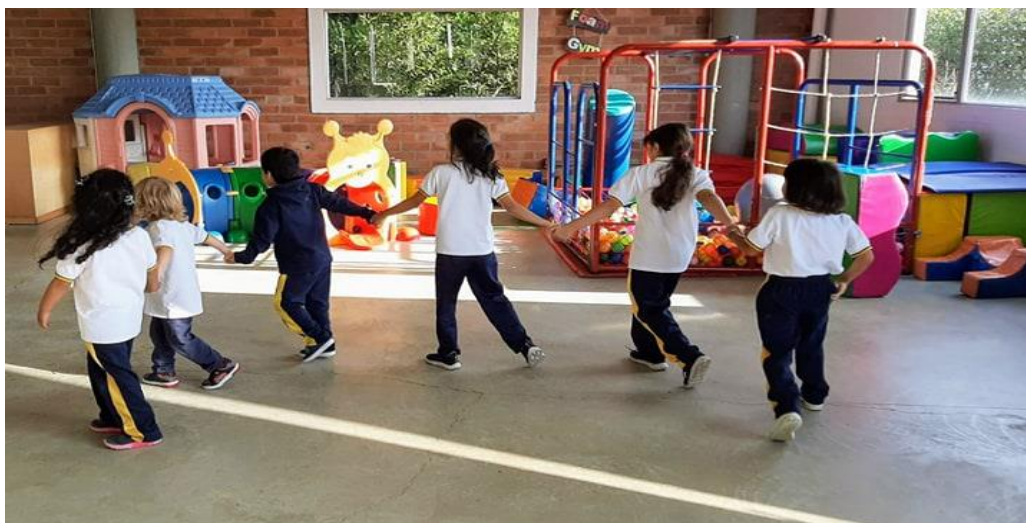
Ilustración 5: Juego cooperativo

Palabras de la profe: “hoy será juego libre”. “Profe y si mejor jugamos todos juntos” respuesta de una niña de 7 años (2019).