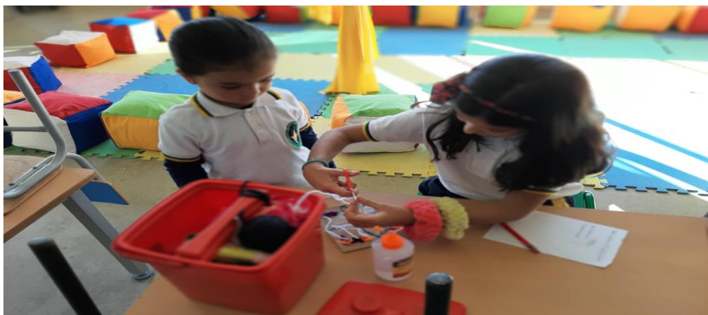
Ilustración 3: Relaciones interpersonales

“Profe yo quiero ayudar, porque me siento jugando a la profe y me siento grande”