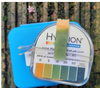
Ilustración 5. Nivel de amoniaco corral 3.