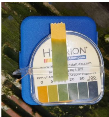
Ilustración 4. Nivel de amoniaco corral 2.