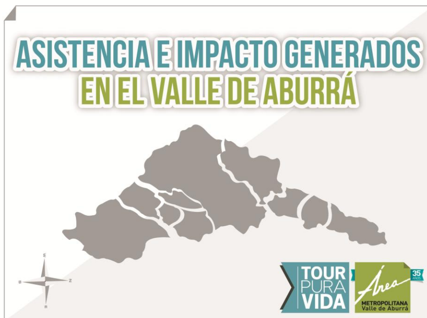
Ilustración 3 Cantidad de eventos