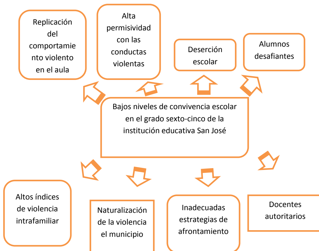
Ilustración 1 -Árbol de problemas

Se evidencia que los bajos niveles de la convivencia escolar en el grupo son multicausales, con razones como la violencia intrafamiliar de la cual pueden ser víctimas muchos de los estudiantes, la naturalización de la violencia en el municipio a causa del desplazamiento forzado, del imaginario machista instaurado por generaciones y demás, de las inadecuadas estrategias de afrontamiento tales como el consumo de sustancias psicoactivas y alcohol, la agresividad ante las desavenencias y diferencias, la poca tolerancia a la frustración y la baja capacidad empática frente a las dificultades de los compañeros y como última posible causa están los docentes autoritarios con escasas de estrategias pedagógicas innovadoras que le permitan a los jóvenes