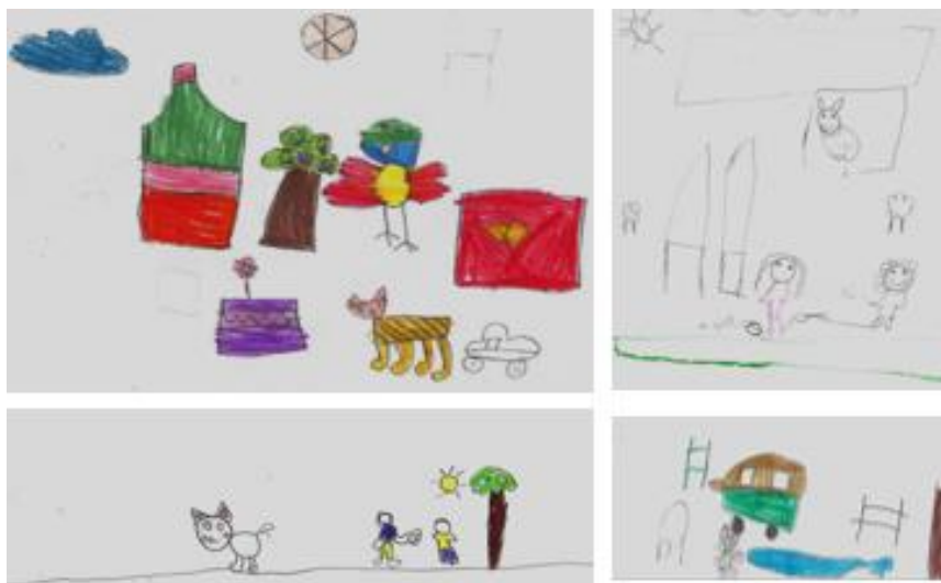
Ilustración 5 Asentimientos

Nota: A través del dibujo, los niñas y niños dan su autorización para que las maestras investigadoras, puedan hacer sus intervenciones investigativas, donde con esta estrategia se busca la participación el reconocimiento de que pueden tomar sus propias decisiones.