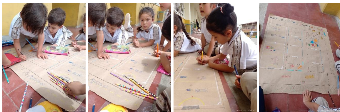
Ilustración 6 cartografía

Nota: Los niños y niñas realizaron una experiencia a través del dibujo y la pintura para plasmar sus percepciones sobre la Institución educativa a través de la cartografía.