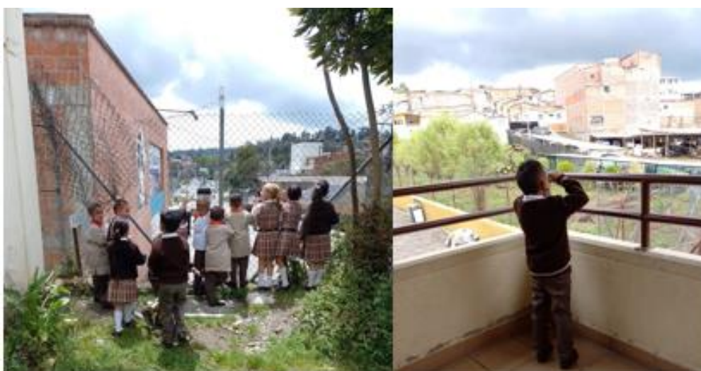
Ilustración 4 Estrategia de Intervención

Nota; intervención pedagógica donde se les permite a los niños y niñas que exploren su entorno como unos grandes investigadores, para así dar su asentimiento y poder ser investigados.