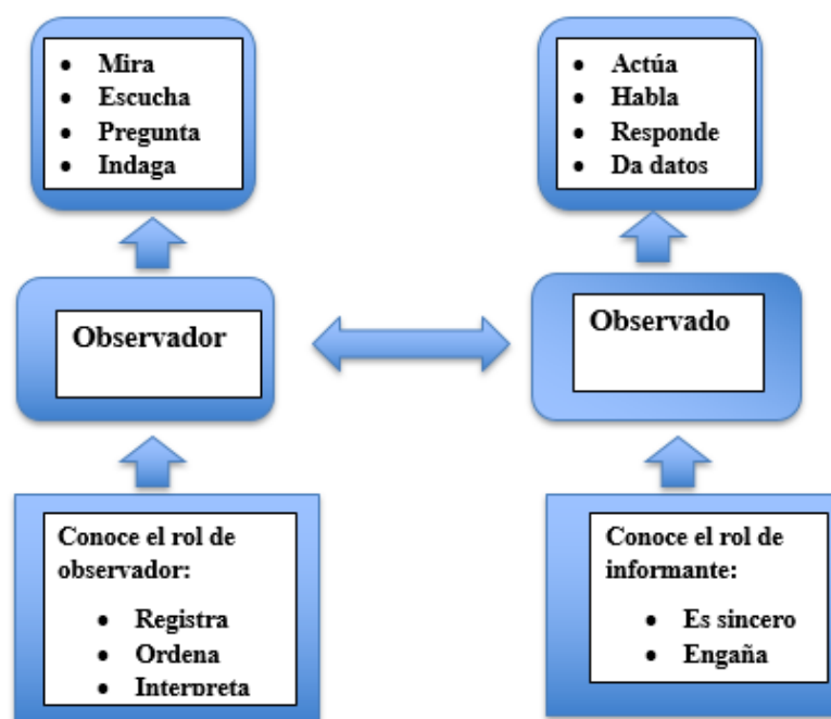
Ilustración 2 Observación

Nota: gráfica realizada a partir de los que implica la observación participante en investigación.