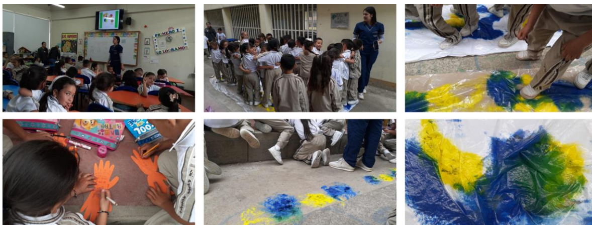
Ilustración 8 Estrategia Pedagógica

Nota: estrategia pedagógica,” Mis Pequeños Colores Grandes Momentos” en la cual se puede vivenciar la intervención y la aceptación con la que los infantes las disfrutan