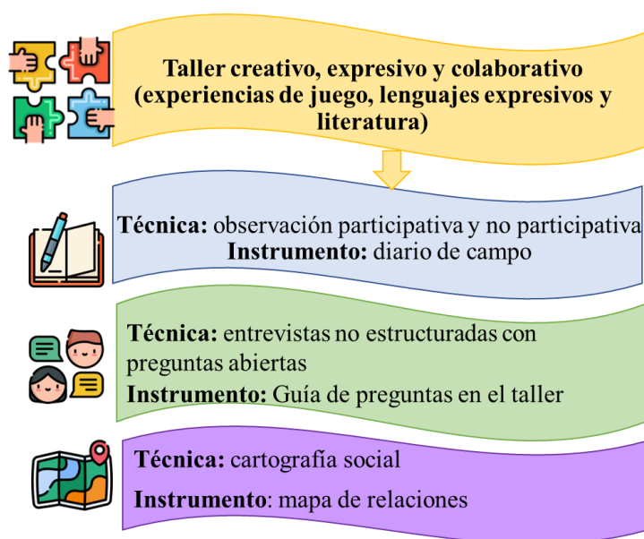
Ilustración 1 Técnicas

Nota: las técnicas de la investigación fueron interactivas donde el taller creativo y la cartografía social fueron protagonistas para lograr construir información con los niños y niñas.