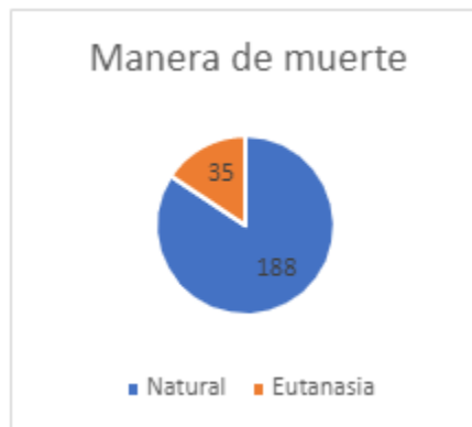
Gráfico 2. Frecuencia absoluta de la manera de muerte de las aves.